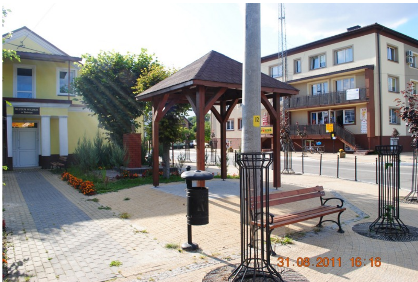
Siedziba Urzędu Gminy