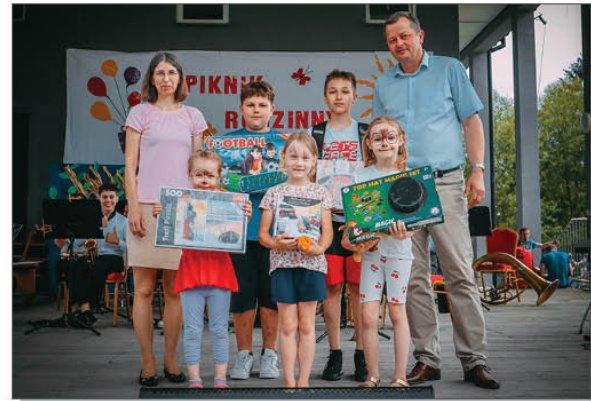
Wręczenie nagród konkursowych