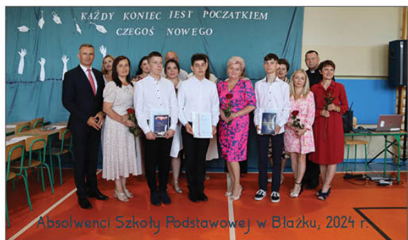
Absolwenci Szkoły Podstawowej w Błazku, 2024 r.