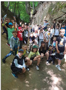
Wycieczka do Kazimierza Dolnego

14 czerwca 2024 r. uczniowie klas 0-III wyjechali na wycieczkę do Kazimierza Dolnego. Podczas wycieczki