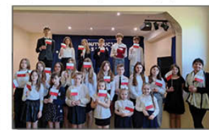
Rocznica Uchwalenia Konstytucji 3 Maja