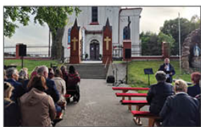
Spotkanie z pieśnią maryjną