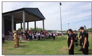
Zbiórka z okazji rozpoczęcia zawodów w Batorzu

Drużyny męskie OSP Batorz i OSP Błażek mają prawo uczestnictwa w zawodach na szczeblu powiatowym, które odbędą się 14 lipca 2024 roku w Modliborzycach. Kobieca Drużyna Pożarnicza OSP Batorz zdobyła 116 pkt i również może wystartować w zawodach powiatowych. Natomiast Chłopięca Drużyna Pożarnicza z Błażka z wynikiem 106 pkt zakwalifikowała się do udziału w Powiatowych Zawodach Sportowo - Pożarniczych Młodzieżowych Drużyn Pożarniczych, które odbędą się w ten weekend w Janowie Lubelskim.