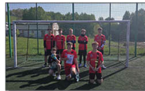
Drużyna piłki nożnej

Tydzień 13 – 17 maja 2024 r. to wyjątkowy tydzień tego roku szkolnego.