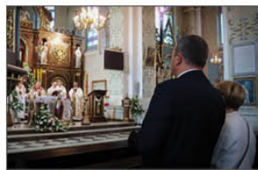
Kadrcz uroczystej Mszy Świętej