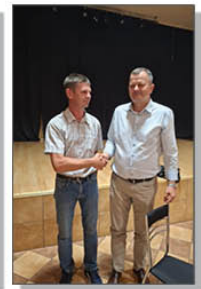
Wójt Gminy z Sołtysem miejscowości Batorz Pierwszy