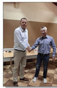
Wójt Gminy z Sołtysem miejscowości Batorz Drugi