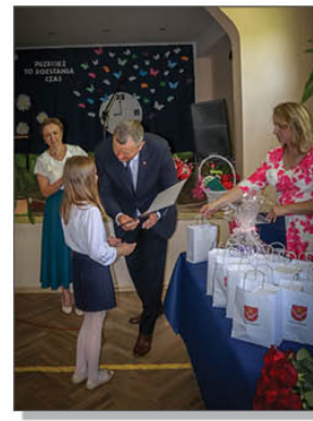
Wręczenie nagród za wysokie osiągnięcia w nauce i wzorowe zachowanie

KOCHANI – wesółych wakacji życzymy - WSZYSTKIM.