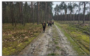
Biegi w Potoczku

uczniom zasady zdrowego odżywiania i przedstawiła tzw. piramidę zdrowia. Następnie uczniowie mieli możliwość skosztowania zdrowych przekąsek, które panie przygotowały specjalnie na tę okazję, te pyszności to były: szaszłyki owocowe, naleśniki z serkiem ricotta (robionym samodzielnie przez panie z KGW), kanapeczki z pysznym pesto do smarowania, a do popicia był koktajl mleczno – owocowy. Wszystko w szybkim tempie znikalo z talerzy.