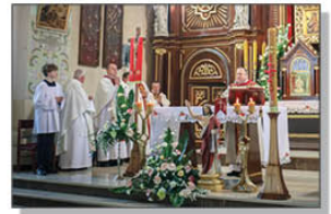
Msza Św. koncelebrowana