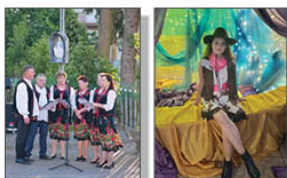
Czeremcha z Samar