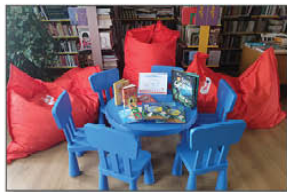
Nagrody rzeczowe, które otrzymała GBP w Batorzu