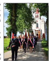
Poczet Sztandarowy Gminy Batorz podczas gminnych obchodów 233. Rocznicy Uchwalenia Konstytucji

Wydarzenie odbyło się w asyście pocztów sztandarowych Gminy Batorz, Zespołu Szkolno-Przedszkolnego w Batorzu oraz jednostek Ochotniczych Straży Pożarnych z terenu naszej Gminy.