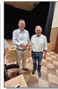
Wójt Gminy z Sołtysem miejscowości Batorz - Kolonia