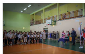
Zakończenie roku szkolnego 2023/2024

To tu zostały wręczone wszelkiego rodzaju nagrody: za wyniki w nauce, za wyniki i udział w