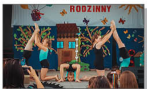
Grupa Akrobatyczna ARKA