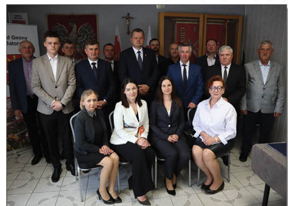
Radni Gminy Batorz oraz Wójt Gminy podczas I sesji Rady Gminy