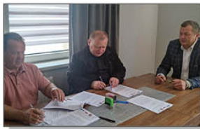
Podpisanie umowy z Wykonawcą na realizację zadania pn. "Wymiana pokrycia dachowego na budynku zabytkowego kościoła w Batorzu Pierwszym

W drodze przetargu wyłoniony został Wykonawca zadania - Firma Remontowo-Budowlana WU-ZET ze Szczepieszyna. W dniu 31 maja 2024 roku podpisana została umowa z Wykonawcą na opracowanie projektu i wykonanie zadania inwestycyjnego. Obecnie trwają prace projektowe i uzgodnienia z druhami strażakami z Ochotniczej Straży Pożarnej w Wólce Batorskiej.