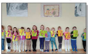
Uczestnicy zajęć w GOK