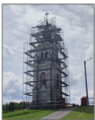
Rozpoczęcie prac związanych z wymianą dachu na dzwonnicy

Firma Zielone Studio z Lublina opracowuje Program Funkcjonalno-Użytkowy, uwzględniający budowę parkingu przy Kościele oraz zagospodarowanie działki naprzeciw GOK: alejki spacerowe, laweczki, fontanna oraz nasadzenia roślin. Opracowywana jest dokumentacja wraz z przedmiarem robót do przetargu. Termin ogłoszenia przetargu przewidyuje się w najbliższym czasie. Wartość projektu 1.500.000,00 zł (w tym 1.350.000,00 zł dotacja z Polskiego Ładu i 150.000,00 wkład własny gminy).