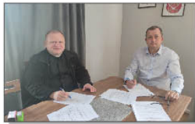
Podpisanie umowy pomiędzy Parafią a Gminą Batorz

W drodze przetargu wyłoniono Wykonawcę zadania - Firmę YETI sp. z o. o z Lublina. Koszt zadania: 1.107.000,00 zł. 11 czerwca br. podpisana została umowa pomiędzy Gminą Batorz a Parafią Rzymsko-Katolicką na przekazanie dotacji. Natomiast w dniu 14 czerwca 2024 r Parafia podpisała umowę na realizację zadania z Wykonawcą, firmą YETI. Termin wykonania przedmiotu umowy - 30 październik 2024r.