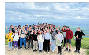
Wycieczka w Bieszczady

Poznajemy również Polskę nie tylko na mapie. Przed zakończeniem roku szkolnego zorganizowane były jeszcze dwie wycieczki w dniach 22-23 maja uczniowie klas IV-VIII wyruszyli 2 autobusami w Bieszczady. Pierwszego dnia wyszliśmy na Poloninę Wetlińską a w drugim dniu był rejs po Jeziorze Solińskim, przeście zaporą i wyjazd kolejką gondolową. Mimo deszczu humory wszystkim dopisywały.