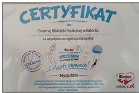
Certyfikat dla GBP w Batorzu za zwycięstwo w ogólnopolskiej akcji

To dzięki naszym czytelnikom, którzy zaangażowali się w głosowanie osiągnęliśmy taki wynik. Dzięki wam nasza biblioteka zmienia się na lepsze.