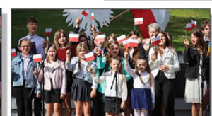
Montaż słowno-muzyczny w wykonaniu uczniów ZSP