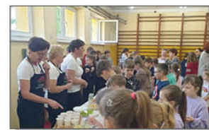
Spotkanie z Kolem Gospodyń Wiejskich

Jak co roku uczczona również została rocznica uchwalenia Konstytucji 3 maja. Część artystyczną przybliżającą krótką historię wprowadzenia konstytucji, którą przygotowali uczniowie naszej szkoły, a także dwa małe przedszkolaki mogli oglądać wszyscy mieszkańcy naszej gminy.