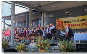
Zespół Śpiewaczy CZEREMCHA z Samar