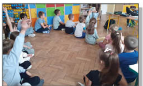
Dzień Głośnego Czytania