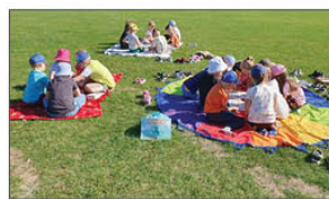
Projekt KAMELEON w grupie 6-latków