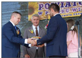
Symboliczne przekazanie chleba na ręce Starosty Janowskiego