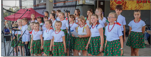
Zespół TERAZ WSZYSCY RAZEM