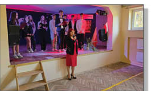
80. Rocznica zakończenia Powstania Warszawskiego