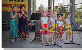
Nauczycielska Grupa Wokalna BELFERKI