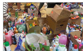
Sortowanie darów dla osób pokrzywdzonych w wyniku powodzi