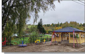
Plac zabaw oraz altana w Batorzu Drugim

ZAGOSPODAROWANIE TERENU POD MIEJSCE REKREACJI I WYPOCZYNKU W MIEJSCOWOŚCI BATORZ DRUGI Dobiegają końca prace polegające nad wykonaniu placu zabaw wraz z altanką. Miejsce rekreacji i wypoczynku zostanie oddane do użytku w październiku tego roku. Beneficjentem jest Stowarzyszenie „Batorska Ziemia”. Stowarzyszenie uzyskało dofinansowanie (w formie refundacji kosztów) z Unii Europejskiej za pośrednictwem LGD Leśny Krąg w Janowie Lubelskim. W budżecie gminy zostały zabezpieczone środki na udzielenie Stowarzyszeniu niezbędnej pożyczki. Koszt zadania: 165.000,00 zł. Wykonawcą zadania jest Firma Dariusz Rachwał z siedzibą w Janowie Lubelskim.