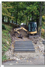
Modernizacja schodów przy cmentarzu parafialnym