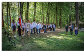
161. Rocznica Bitwy pod Batorzem