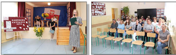
Narodowe Czytanie "KORDIANA"