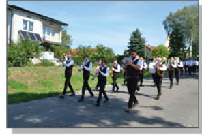
Dożynki Gminno - Parafialne w Stróży

Orkiestra Dęta z Batorza uczestniczyła w Dożynkach Gminno - Parafialnych Gminy Kraśnik, które odbyły się w miejscowości Stróża w niedzielę 25 sierpnia br. Uroczystości rozpoczęła Msza Św. Odpustowa w kościele pw. Trójcy Przenajświętszej i Matki Bożej Częstochowskiej w Stróży-Kolonii. Po mszy św. korowód dożynekowy na czele z Orkiestrą Dętą z Batorza oraz pocztami sztandarowymi jednostek OSP i przeszedł na stadion sportowy przy Szkole Podstawowej w Stróży, gdzie odbywały się główne uroczystości.