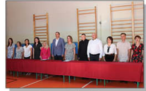
Inauguracja roku szkolnego