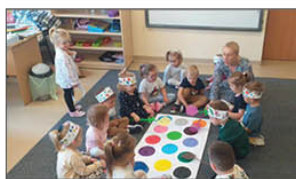
Zabawy z okazji Dnia Przedszkolaka

6 latki i klasy 1-3 przystąpiły do ciekawego projektu „Kameleon”. Projekt ma na celu przeniesienie procesu nauczania poza mury szkoły na łono natury. Pierwsze zajęcia na łonie natury już się odbyły. W wrześniu było również święto przedszkolaka i ten dzień świętowały wszystkie grupy przedszkolne.