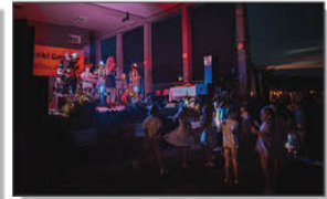
Wieczorny koncert Zespołu SK-1 na kompleksie sportowo - rekreacyjnym