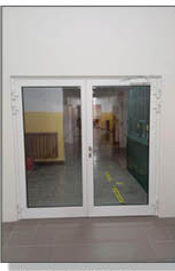
Nowe drzwi w ZSP w Batorzu

MODERNIZACJA ODWODNIENIA PRZY BUDYNKU ZSP W BATORZU Prace dotyczyły obszaru wzdłuż całego budynku szkoły (wraz z halą gimnastyczną). Wymieniono kostkę brukową przed wejściem oraz naprawiono przejście wzdłuż hali. Zamontowano nowe balustrady przy schodach oraz odnowiono dotychczasowe. Skarpa została wzmocniona przed osuwaniem. Koszt zadania wyniósł 188 797,42zł. Całość sfinansowano ze środków Gminy Batorz. Wykonawcą zadania: Firma BDBRUK Daško Bogusław.