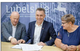
Włączenie umów z Funduszu Ochrony Gruntów Rolnych

DOSTOSOWANIE BUDYNKU ZESPÓŁU SZKOLNO-PRZEDSZKOLNEGO W BATORZU DO ZALECEŃ WIĄZANYCH Z BEZPIECZYSTWEM POŻAROWYM Prace polegały głównie na wymianie 6 sztuk drzwi aluminiowych na nowe, posiadające atest przeciwpożarowy. Zostały również wykonane niezbędne prace tynkarskie i malarskie wokół nowo zamontowanych drzwi. Zadanie to jest zgodne z wymogami nałożonymi przez Państwową Straż Pożarną. Wykonawcą zadania była Firma Dariusz Rachwał z siedzibą w Janowie Lubelskim. Koszt zadania: 65.698,43 zł. Sfinansowano ze środków Gminy Batorz. Ponadto dzięki sponsorom i ochotnikom dokonano wymiany drzwi wewnętrznych, prowadzących do klas szkolnych, znajdujących się na parterze budynku. Pracownicy szkoły wraz z zaangażowanymi rodzicami niektórych uczniów, odnowili korytarz na parterze. Przy głównym wejściu zamontowano nowe, granitowe tablice informacyjne.