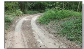
Droga Błażek - Pasieka tzw. "Babia Zdebrza"

REMONTY DRÓG GRUNTOWYCH SPYCHARKA Na przełomie września i października przeprowadzono remonty dróg gruntowych: 1. Batorz - Otrocz "Ruska Droga". 2. Błażek - Pasieka "Babia Zdebrza". 3. Samary - Blinów "Głębokie".