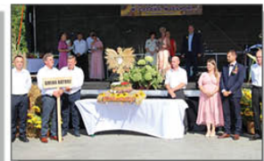
Korowód dożynkowy z sołectwa Wólka Batorska

dobro walczy ze złem, a prawda z kłamstwem, ale na pierwszym planie umieścił polskiego patriotę – z jego tęsknotą za wolną ojczyzną, wyzwoloną spod rosyjskiego jarzma. Dlatego właśnie w tym roku chce państwa zaprosić do Narodowego Czytania „Kordiana”.