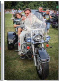
Impersonator Elvisa Presleya