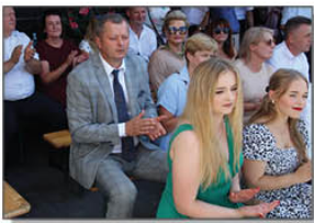
Uczestnicy uroczystości dożynkowych