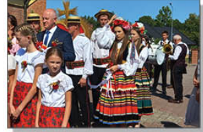
Dożynki Parafialne w Brzezinach

8 września w Parafii pw. Miłosierdzia Bożego i Matki Bożej Fatimskiej w Brzezinach odprawiona została Msza Święta Dożynekowa. Oprawę muzyczną uroczystości zapewniła nasza Orkiestra Dęta z Batorza.