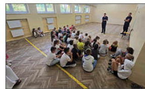
Spotkanie z Policją