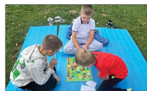
Projekt KAMELEON w klasie III