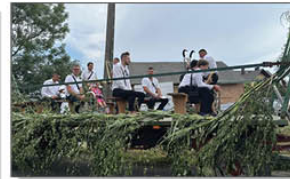
Przejazd Orkiestry Dętej z Batorza na tzw. "furze"