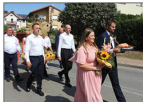
Starostowie z Wólki Batorskiej