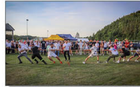
Przeciąganie liny przez członków korowodów dożynkowych z poszczególnych sołectw