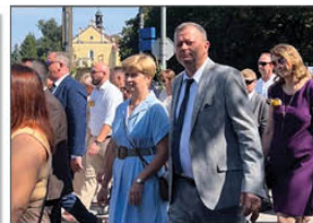
Wójt Gminy Batorz wraz z Małżonką