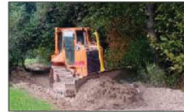
Prace na odcinku Samary - Blinów "Głębokie"

WYKONANIE GARAZU PRZY STRAZNICZY OSP WÓLKA BATORSKA Wniosek dotyczący pozwolenia na budowę obecnie procedowany jest w Starostwie Powiatowym w Janowie Lubelskim.