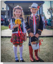
Najmłodszy członkowie korowodów