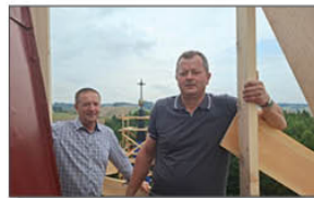
Wizyta nadzorująca przebieg inwestycji