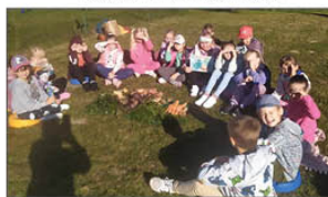
Projekt KAMELEON w klasie

6 latki i klasy 1-3 przystąpiły do ciekawego projektu „Kameleon”. Projekt ma na celu przeniesienie procesu nauczania poza mury szkoły na łono natury. Pierwsze zajęcia na łonie natury już się odbyły. W wrześniu było również święto przedszkolaka i ten dzień świętowały wszystkie grupy przedszkolne.