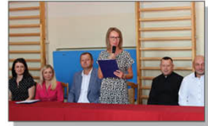
Pierwsze, oficjalne przemówienie p. Dyrektorki i powitanie uczniów klasy pierwszej. Mali uczniowie z radością na twarze przekroczyli progi naszej szkoły.