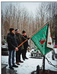
Poczta sztandarowa NSZZ RI Solidarność