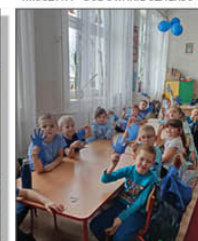
ZNAMY SWOJE PRAWA!