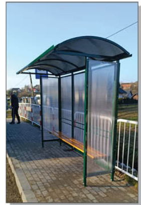
Wiaty przystankowe w miejscowości Wólka Batorska

Zakupiono przedmiotową działkę wraz z znajdującym się na niej budynkiem mieszkalnym. Teren ten zostanie przeznaczony na parking dla interesantów. Koszt zakupu: 258.215,70 zł.