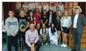
DZIEŃ EDUKACJI NARODOWEJ - AKADEMIA I