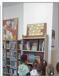
NOWE KSIĄŻKI W BIBLIOTECE