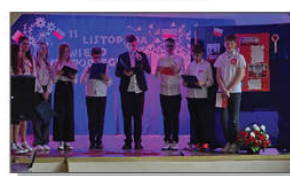
INSCENIZACJA Z OKAZJI ŚWIĘTA NIEPODLEGŁOŚCI