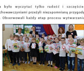
Konkurs poezji patriotycznej w grupie „Pszczółek”