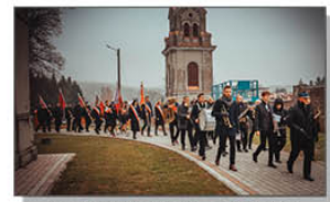
Uroczysty przemarsz z Orkiestrą Dętą na czele