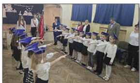
Ślubowanie klasy pierwszej