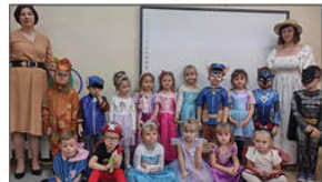
DZIEŃ POSTACI BAJEK

Omówienie tradycji świąt Bożego Narodzenia, zapoznanie się z techniką wykonywania świątecznych ozdób i wykonanie przez każde dziecko stroika