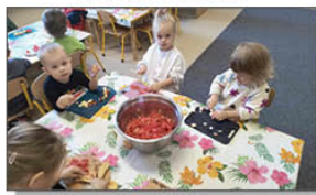
DZIEŃ OWOCÓW I WARZYW W PRZEDSZKOLU