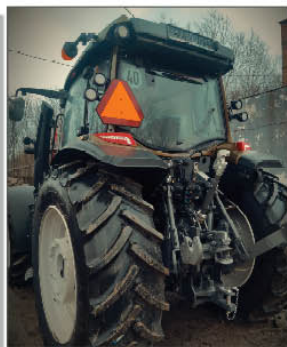
Dostawa nowozakupionego ciągnika marki VALTRA