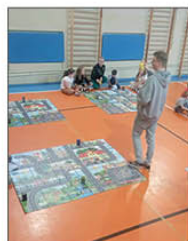
WARSZTATY ROBOTYCZNE I