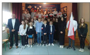
11 LISTOPADA - SZKOŁA DO HYMNU

Dnia 16 października 2024 r. w naszej szkole obchodziliśmy Dzień Edukacji Narodowej. W uroczystym apelu wzięli udział pedagodzy, uczniowie, rodzice. Uczniowie w sposób humorystyczny przedstawili scenki, jak postępowany jest nauczyciel przez różne osoby, które to scenki rozweseliły nauczycieli, rodziców i uczniów.