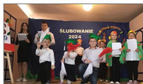
ŚLUBOWANIE UCZNIÓW KLASY PIERWSZEJ - TANIEC Z SZARFAMI

We współpracy z Powiatową Stacją Sanitarno - Epidemiologiczną w Janowie Lubelskim zorganizowaliśmy wartościowe zajęcia edukacyjne