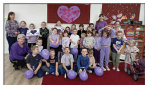
CAŁA SZKOŁA NA FIOLETOWO!