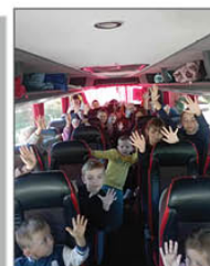
WYCIECZKA NA SPEKTAKL