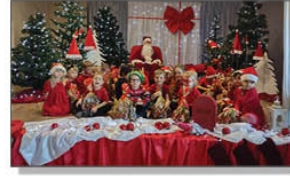
Mikołaj w przedszkolu