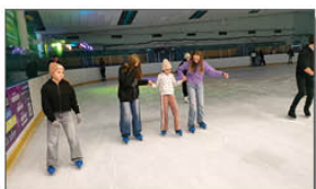
ICEMANIA - WYCIECZKA DO LUBLINA