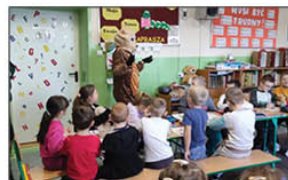
DZIEŃ PLUSZOWEGO MISIA

W ramach obchodów Święta Niepodległości w piątek 8 listopada odbyła się uroczysta akademia. Spotkanie rozpoczęliśmy o godz. 11 00 od wspólnego odśpiewania hymnu narodowego w ramach akcji "Szkoła do hymnu". Poprzez poezję i muzykę przybliżyliśmy historię oraz uczciliśmy pamięć tych, którym zawdzięczamy własne, wolne państwo. Uczniowie naszej szkoły brali również udział w gminnych obchodach Święta Niepodległości w Batorzu, gdzie poprzez inscenizację i śpiew uświetnili uroczystości gminne.