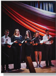
Część artystyczna w sali widowiskowej GOK