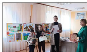
KONKURS JEŚCIEN INSPIRUJE - KSIĄŻKĘ KOLORUJĘ

Wzięliśmy również udział w I Gminnym konkursie plastycznym "Kalendarz 2025 - Gmina Batorz w oczach dziecka".