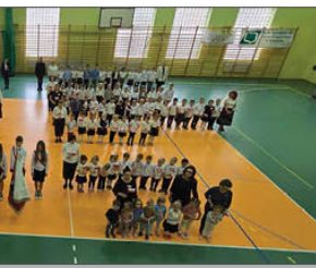
„SZKOŁA DO HYMNU”- WSPÓLNE ŚPIEWANIE HYMNU O GODZINIE 11:11