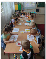
ŚWIĄTY DZIEŃ ZWIERZĄT