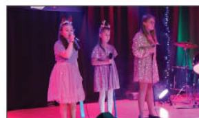
Trio wykonujące utwór na koncercie

Uczestników tego wyjątkowego wydarzenia odwiedził św. Mikołaj, częstując wszystkich zebranych słodyczkami.