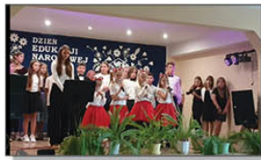
DZIEŃ EDUKACJI NARODOWEJ