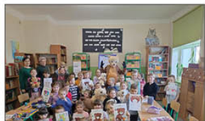
PRZEDSZKOLAKI I PLUSZOWY MIS

Jesteśmy niezwykle zaszczytzeni nominacją w plebiscytcie na Szkołę Roku! Ponadto nasi nauczyciele zostali nominowani w kategorii Nauczyciel Roku klas I-III oraz Nauczyciel Roku klas IV-VIII. Jest to dla nas cenne tym bardziej, że to sami rodzice zgłaszają nominację. Nasza szkoła to nie tylko budynek, ale przede wszystkim społeczność ludzi, którzy wspierają się nawzajem. Dziękujemy za to wyróżnienie i za każdy oddany na nas głos!