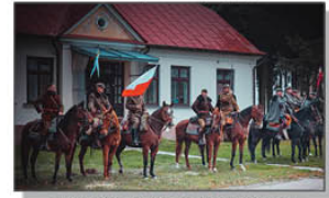
GRH plk. Zieleniewskiego z Majdanu Obleszcze