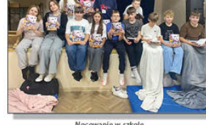
Nocowanie w szkole