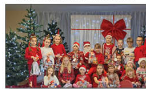
MIKOŁAJ W KLASACH 1-3