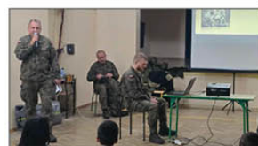
EDUKACJA Z WOJSKIEM