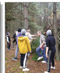
WYCIECZKA PRZYRODNICZA DO KRUSZYNY - BUDOWANIE SZALASU