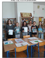
KONKURS NA PLAKAT PROMUJĄCY CZYTELNICTWO W RAMACH NPRCZ