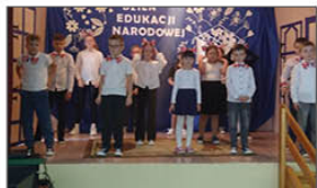
DZIEŃ EDUKACJI NARODOWEJ W JĘZYKU ANGIELSKIM!

W ramach obchodów Święta Niepodległości w piątek 8 listopada odbyła się uroczysta akademia. Spotkanie rozpoczęliśmy o godz. 11 00 od wspólnego odśpiewania hymnu narodowego w ramach akcji "Szkoła do hymnu". Poprzez poezję i muzykę przybliżyliśmy historię oraz uczciliśmy pamięć tych, którym zawdzięczamy własne, wolne państwo. Uczniowie naszej szkoły brali również udział w gminnych obchodach Święta Niepodległości w Batorzu, gdzie poprzez inscenizację i śpiew uświetnili uroczystości gminne.