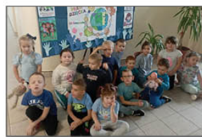
DZIEŃ PRAW DZIECKA