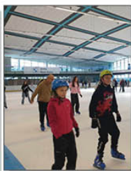
WYJAZD NA ŁODOWISKO

Siódmego listopada odbył się „Bal postaci bajek”. Dzieci wcieliły się w różne postaci bajek i świetnie się bawiły tańcząc oraz grając w różne gry i zabawy. Były również: quiz o bajkach, bajkowe puzzle, kino, kolorowanki i słodki poczęstunek. Również panie nauczycielki w ten dzień nie były zwykłymi nauczycielkami lecz księżniczkami, nimfami i wróżkami .