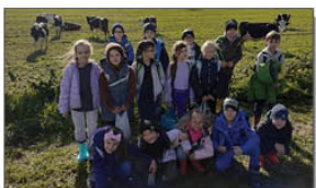
Z WIZYTĄ W GOSPODARSTWIE ROLNYM