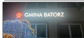
Nowy napis led zamontowany na elewacji budynku Urzędu Gminy