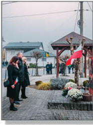
Złożenie kwiatów przy pomniku J. Piłsudskiego