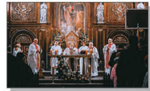
Msza Święta w intencji Ojczyzny