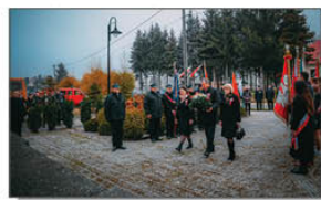
Złożenie kwiatów przez Władze Gminy Batorz