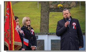
Przemówienie Wójta Gminy Batorz