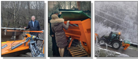
Odbiór nowozakupionych maszyn do utrzymania dróg gminnych