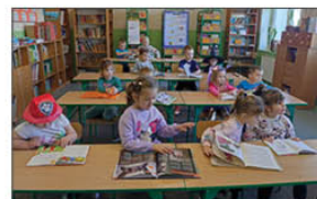
DZIEŃ POSTACI Z BAJEK

Podczas wycieczek uczniowie mają okazję poszerzać swoje horyzonty i poznawać świat w praktyce. Takie aktywności pozwalają rozwijać samodzielność i umiejętności społeczne. W październiku odbyły się dwie wycieczki, jedna na spektakl „Królowa Śnieżka” do Kraśnika, druga na warsztaty przyrodnicze do Kruszyny (koło Stalowej Woli). Natomiast 20 listopada uczniowie wraz z opiekunami udali się na niezwykłą wycieczkę do Lublina. Pierwszym punktem atrakcji był seans w kinie Cinemacity - "Dziki Robot". Następnie nadzedli czas na rozruszanie się, do wyboru było lodowisko ICEMANIA, a dla pozostałych park trampolin - Strefa Wysokich Lotów.