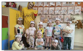
DZIEŃ PLUSZOWEGO MISIA W PRZEDSZKOLU