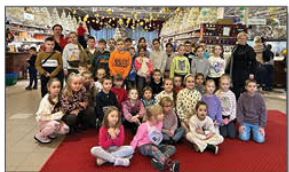
Wycieczka do Fabryki bombek w Nowej Dębie