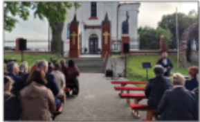
"Spotkanie z pieśnią maryjną"