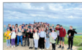
Wycieczka w Bieszczady

Poznajemy również Polskę nie tylko na mapie. Przed zakończeniem roku szkolnego zorganizowane były jeszcze dwie wycieczki w dniach 22-23 maja uczniowie klas IV-VIII wyruszyli 2 autokarami w Bieszczady. Pierwszego dnia wysłaliśmy na Poloninę Wellińską a w drugim dniu był rajz po Jeziorze Solińskim, przejeżdżając zapoczął wyjazd kolejką gondolową. Mimo deszczu humory wszystkim dopływały.