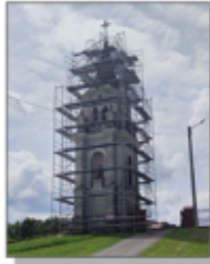
Rozpoczęcie prac związanych z wymianą dachu na dzwonnicy

Firma Zielone Studio z Lublina opracowuje Program Funkcjonalno-Użytkowy, uwzględniający budowę parkingów przy Kościele oraz zagospodarowanie działki naprzeciw GOK: alejki spacerowe, ławeczki, fontana oraz nasadzenia roślin. Opracowywana jest dokumentacja wraz z przedmiarem robót do przetargu. Termin ogłoszenia przetargu przewiduje się w najbliższym czasie. Wartość projektu 1.500.000,00 zł (w tym 1.350.000,00 zł dotacja z Polskiego Ładu i 150.000,00 wkład własny gminy).