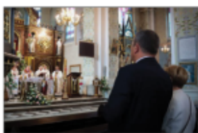
Kadrcz uczestnicy Mszy Świętej