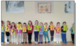
Uczestnicy zajęć w GOK