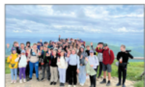
Wycieczka w Bieszczady

Poznajemy również Polskę nie tylko na mapie. Przed zakończeniem roku szkolnego zorganizowane były jeszcze dwie wycieczki w dniach 22-23 maja uczniowie klas IV-VIII wyruszyli 2 autokarami w Bieszczady. Pierwszego dnia wyszliśmy na Poloninę Wellińską a w drugim dniu był rajz po Jeziorze Solińskim, przejeżdżając zapoczął wyjazd kolejką gondolową. Mimo deszczu humory wszystkim dopływały.