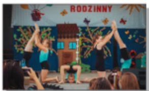
Grupa Akrobatyczna ARKA