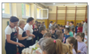
Spotkanie z Kolem Gospodyni Wiejskich