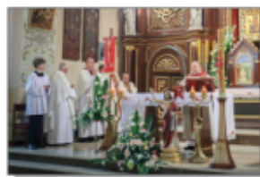
Mza Św. koncelebrowana