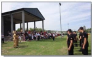
Zbiórka z okazji rozpoczęcia zawodów w Batorzu

Drużyny męskie OSP Batorz i OSP Białek mają prawo uczestnictwa w zawodach na szczeblu powiatowym, które odbędą się 14 lipca 2024 roku w Modliborzycach. Kobieca Drużyna Pożarnicza OSP Batorz zdobyła 116 pkt i również może wystartować w zawodach powiatowych. Natomiast Chłopięca Drużyna Pożarnicza z Białka z wynikiem 106 pkt zakwalifikowała się do udziału w Powiatowych Zawodach Sportowo-Pożarniczych Młodzieżowych Drużyn Pożarniczych, które odbędą się w ten weekend w Janowie Lubelskim.