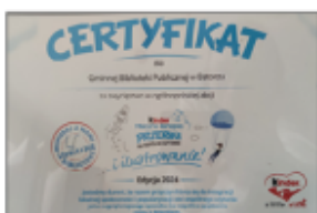
Certyfikat dla GBP w Batorzu za zwycięstwo w ogólnopolskiej akcji

To dzięki naszym czytelnikom, którzy zaangażowali się w głosowanie osiągnęliśmy taki wynik. Dzięki wam nasza biblioteka zmienia się na lepsze.