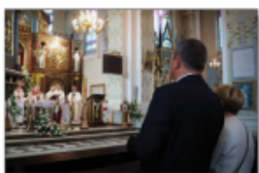
Kadry uczestnicy Mszy Świętej