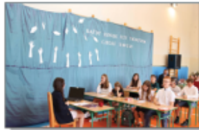
Zakończenie roku szkolnego 2023/2024