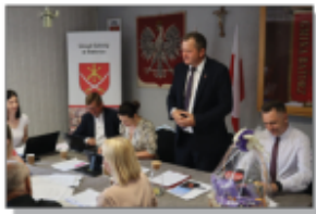
8 sesja Rady Gminy Batorz