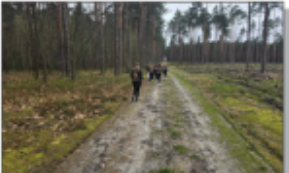
Bieg w Potoczku

uczniom zasady zdrowego odżywiania i przedstawiła tzw. piramidę zdrowia. Następnie uczniowie mieli możliwość skosztowania zdrowych przekąsek, które panie przygotowały specjalnie na tę okazję, te pyszności to były: szaszłyki owocowe, naleśniki z serkiem ricotta (robionym samodzielnie przez panie z KGW), kanapeczki z pysznym pesto do smarowania, a do popicia był koktajl mleczno – owocowy. Wszystkie w szybkim tempie zniknęły z talerzy.