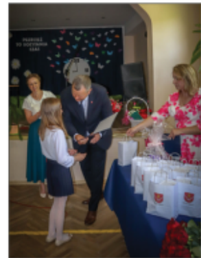
Wręczenie nagród za wysokie osiągnięcia w nauce i wzorowe zachowanie

KOCHANI – wesołych wakacji życzymy – WSZYSTKIM.