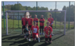
Drużyna piłki nożnej

Tydzień 13 – 17 maja 2024 r. to wyjątkowy tydzień tego roku szkolnego.