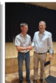
Wójt Gminy z Sołtysem miejscowości Batorz Pierwszy