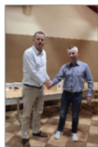
Wójt Gminy z Sołtysem miejscowości Batorz Drugi