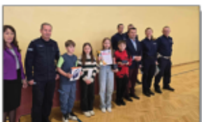
Powiatowy turniej BRD w Koczulcu