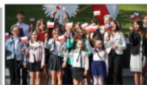
Morzeć słowno-oznaczony w wykonaniu uczniów ZSP