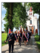
Poczt Sztandarowy Gminy Batorz podczas gminnych obchodów 233. Rocznicy Uchwalenia Konstytucji

Wydarzenie odbyło się w asyście pocztów sztandarowych Gminy Batorz, Zespołu Szkolno-Przedszkolnego w Batorzu oraz Jednostek Ochotniczych Straży Pożarnych z terenu naszej Gminy.