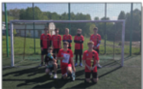
Drużyna piłki nożnej

Tydzień 13 – 17 maja 2024 r. to wyjątkowy tydzień tego roku szkolnego.