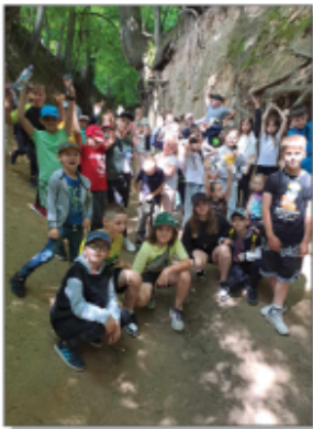
Wycieczka do Kazimierza Dolnego

dzieci uczestniczyły w warsztatach edukacyjnych w pracowni sztuki artystycznej i podziwiali piękne nawiązańskie krajobrazy, płynąc statkiem po Wiśle. Po pysznym obiedzie w pełni sił wyruszyli meksykański do Wąwozu Korzeniowego. Kolejnym punktem pobytu w Kazimierzu był spacer po Rybku, gdzie oprócz podziwiania architektury tego niezwykłego miejsca, dzieci mogły zakupić również pamiątki. Ostatnim punktem było zwiedzanie Wzgórza Zamkowego oraz Kościoła Farnego. Wszyscy bardzo miło wspominają ten dzień.