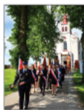
Poczt Sztandarowy Gminy Batorz podczas gminnych obchodów 233. Rocznicy Uchwalenia Konstytucji

Wydarzenie odbyło się w asyście pocztów sztandarowych Gminy Batorz, Zespołu Szkolno-Przedszkolnego w Batorzu oraz Jednostek Ochotniczych Straży Pożarnych z terenu naszej Gminy.