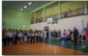
Zakończenie roku szkolnego 2023/2024

To tu zostały wręczone wszelkiego rodzaju nagrody: za wyniki w nauce, za wyniki i udział w