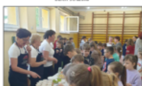
Spotkanie z Kolem Gospodyni Wiejskich