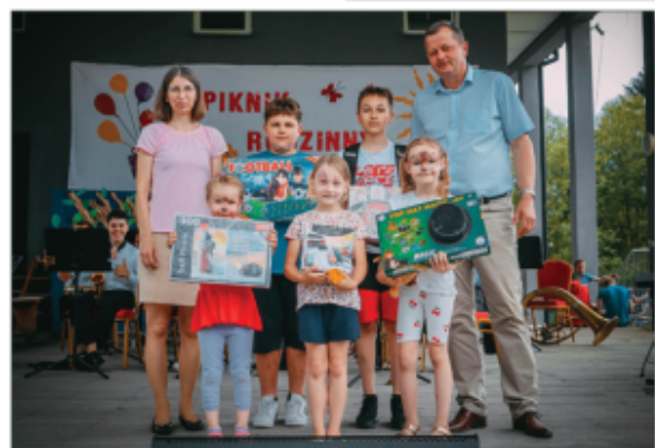
Wypczenie nagród konkursowych