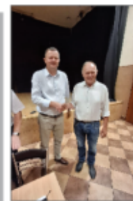
Wójt Gminy z Sołtysem miejscowości Batorz - Kolonia