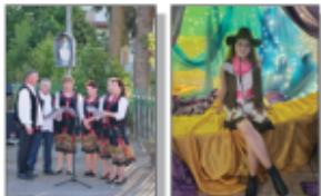
Czerwca z Samar