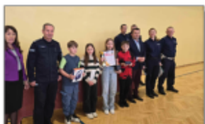
Powiatowy turniej BRD w Koczulzy