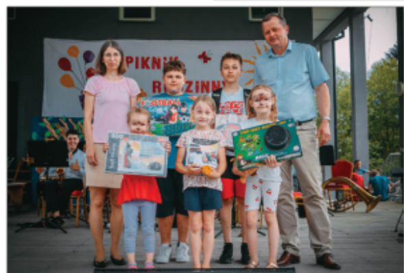
Wypczenie nagród konkursowych