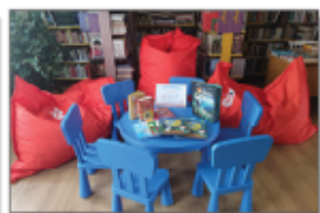
Nagrody rzeczowe, które otrzymała GBP w Batorzu