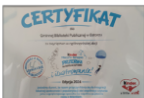
Certyfikat dla GBP w Batorzu za zwycięstwo w ogólnopolskiej akcji

To dzięki naszym czytelnikom, którzy zaangażowali się w głosowanie osiągnęliśmy taki wynik. Dzięki wam nasza biblioteka zmienia się na lepsze.