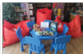
Nagrody rzeczowe, które otrzymała GBP w Batorzu