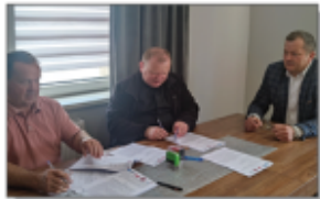
Podpisanie umowy z Wykonawcą na realizację zadania pn. "Wymiana pokrycia dachowego na budynku zabytokowego kościoła w Batorzu Pierwszym"

W drodze przetargu wyłoniony został Wykonawca zadania - Firma Remontowo-Budowlana WU-ZET ze Szczepieszyna. W dniu 31 maja 2024 roku podpisana została umowa z Wykonawcą na opracowanie projektu i wykonanie zadania inwestycyjnego. Obecnie trwają prace projektowe i uzgodnienia z druhmami strażakami z Ochotniczej Straży Pożarnej w Wólce Batorskiej.