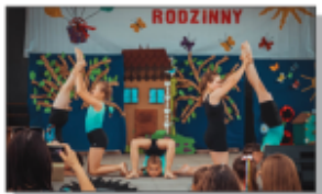
Grupa Akrobatyczna ARKA