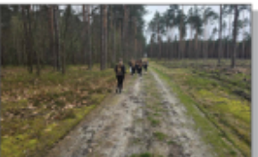
Bieg w Potoczku

uczniom zasady zdrowego odżywiania i przedstawiła tzw. piramidę zdrowia. Następnie uczniowie mieli możliwość skosztowania zdrowych przekąsek, które panie przygotowały specjalnie na tę okazję, te pyszności to były: szaszłyki owocowe, naleśniki z serkiem ricotta (robionym samodzielnie przez panie z KGW), kanapeczki z pysznym pesto do smarowania, a do popicia był koktajl mleczno – owocowy. Wszystkie w szybkim tempie zniknęły z talerzy.