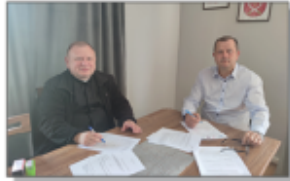
Podpisanie umowy pomiędzy Parafią a Gminą Batorz

W drodze przetargu wyłoniono Wykonawcę zadania - Firmę YETI sp. z o.o. z Lublina. Koszt zadania: 1.07.000,00 zł. 11 czerwca br. podpisana została umowa pomiędzy Gminą Batorz a Parafią Rzymsko-Katoliczną na przekazanie dotacji. Natomiast w dniu 14 czerwca 2024 r. Parafia podpisała umowę na realizację zadania z Wykonawcą, firmą YETI. Termin wykonania przedmiotu umowy - 30 października 2024r.