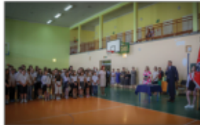
Zakończenie roku szkolnego 2023/2024

To tu zostały wręczone wszelkiego rodzaju nagrody: za wyniki w nauce, za wyniki i udział w