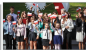
Morzarz słowno-uczuciowy w wykonaniu uczniów ZSP