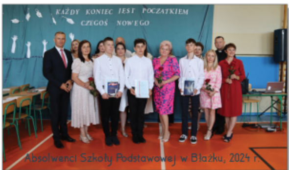
Absolwenci Szkoły Podstawowej w Białku, 2024 r.