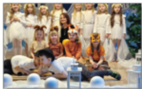
Przedstawienie na chalcie szkolnej (Motyli) – 6 latki

U nas również odbyły się eliminacje gminne konkursu OTWP pod hasłem „Młodzież zapobiega pożarom”. Do konkursu przystąpiło 12 uczniów ze szkół w Batorzu i Błazku, a eliminacje zostały przeprowadzone w dwóch grupach wiekowych: grupa I (klasy I-IV), grupa II (klasy V-VIII). Z radością informujemy, że I miejsce z grupy drugiej zajęła