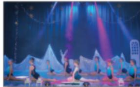
Grupa akrobatyczna podczas koncertu Noworocznego

Wszyscy Razem” wystąpił w GOK w Modliborzycach podczas koncertu z okazji Wielkiej Orkiestry Świątecznej Pomocy. Zespół wykonał repertuar popowy: „Dzięki że jesteście”, „Ramię w ramię” oraz „Szary świat”.