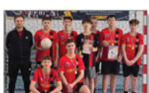
Nasza drużyna na Dniach Otwartych w ZSOR w Potoczku

Należy się również pochwalić, że 12 marca nasi uczniowie z klas 7-8 zostali zaproszeni na turniej piłki halowej o Puchar Dyrektora Zespołu Szkół Centrum Kształcenia Rolniczego w Potoczku. Nie tylko świetnie się prezentowali w nowych strojach zakupionych dla Uczniowskiego Klubu Sportowego ze środków Rządowego Programu „Klub 2023” oraz dofinansowania Banku Spółdzielczego w Batorzu,