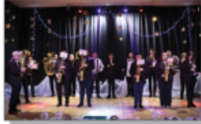
Orkiestra podczas koncertu Noworocznego