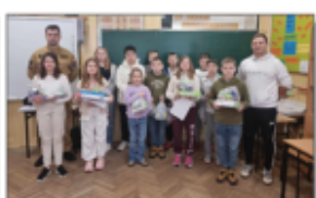
Konkurs wiedzy połączony