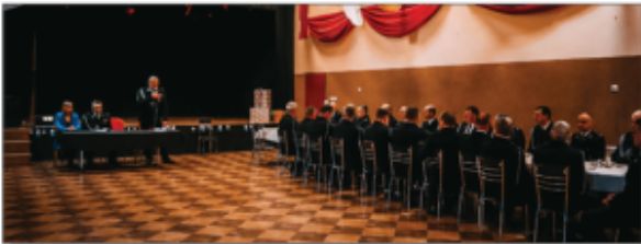
Posiedzenie Zarządu Oddziału Gminnego ZOSP RP w Batorzu