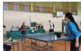
Zawodnicy tenisa stołowego – uczestnicy IV kategorii (grupa żeńska)