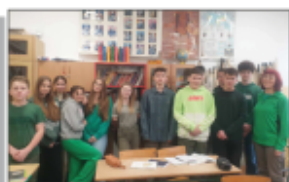
Zielony wtorek w kl. VII

Nie flipt także przedszkolaki. 26 lutego w przedszkolu dodatkowo obchodzony był „Dzień Dinosaurów”. Na zajęciach dzieci poznawali