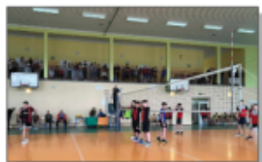
Powiatowe zawody w piłkę siatkową