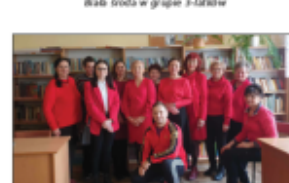
Grupa pedagogiczna w czerwień