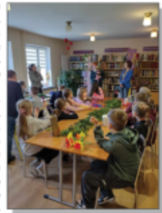
Warsztaty poprowadzone przez KGW Malina z Błazka