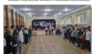
Inscenizacja w rocznicę wybuchu Powstania Styczniowego