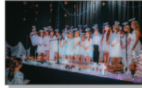
Zespół Teraz Wszyscy Razem