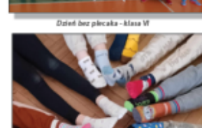
Dzień kolorowej skarpetki – Dzień solidarności z chorymi na zespół Downa

Jeśli ktoś chce, by jego dziecko było bezpieczne, dobrze się uczyło i bawiło, to zapraszamy je do naszego przedszkola. Rekrutacja na rok szkolny 2024/25 trwa od 20.01 do 31.03, a wnioski są dostępne na stronie internetowej szkoły lub w sekretariacie w godz. 8.00 - 15.00.