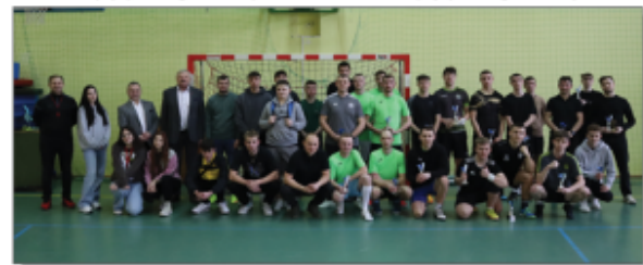
Uczestnicy II kategorii wiekowej wraz z Wójtem Gminy Batorz, Dyrektorem GOK oraz Wicdyrektorem ZSP w Batorzu