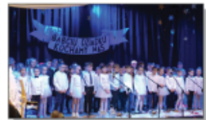
Dzień Babci i Dziadka w klasach 1-4II

W styczniu uczęszczające do szkoły dzieci świetnie się bawiły na zabawie choinkowej począwszy od przedszkolaków, aż do uczniów najstarszych klas. Grupa 6-latków pod kierunkiem pani A. Śmiełek wystąpiła z przedstawieniem o tematyce zimowej, a rodzice