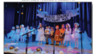
Dzień Babci i Dziadka w przedszkolu