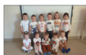
Białe środa w grupie 3-letków