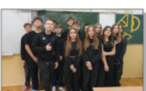
Czarny piątek w kl. Vb