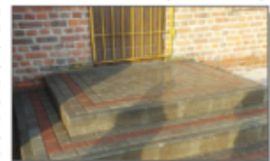
Schody przed budynkiem remizy OSP w Stawcach-Kolonii

PRACE PRZY BUDYNKU REMIZY OSP W STAWCACH-KOLONII Dobiegają końca prace brukarskie polegające na wykonaniu schodów wejściowych oraz odwodnienia budynku strażnicy.