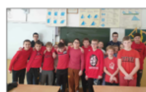
Czerwony czwartek w kl. VI