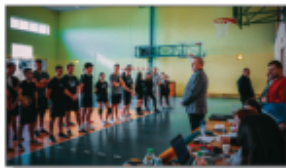
Otwarcie XIII Turnieju Piłki Siatkowej