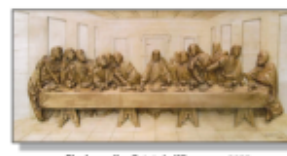
Rzeźba Ostatnia Wieczerza, 2023

Artysta z Błażka wydobywa z drewna postaci świętych, elementy dekoracyjne kościołów, a także prace o tematyce ludowej. Artysta jest "samoukiem", nie kształcił się w żadnej szkole