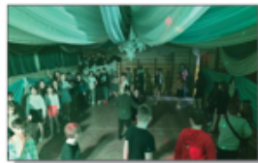
Dyskoteka Walentynkowa integracyjna z młodzieżą z Błazka