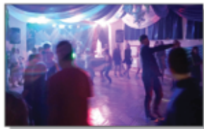
... a tak się bawiły na chalcie starsze klasy