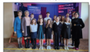
Konkurs recytatorów wierszy o Powstaniu Styczniowym