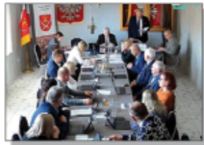
Radni podczas XLII Sesji Rady Gminy Batorz