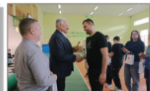
Wyręczenie pucharów Wójta Gminy Batorz oraz skromnych upominków