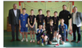
Zwycięcy w I kategorii wiekowej