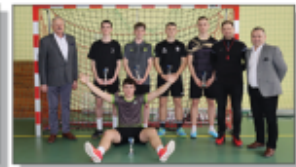
Zwycięcy w II kategorii wiekowej