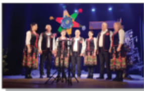
Zespół "Czeremcha" w Modliborzycach