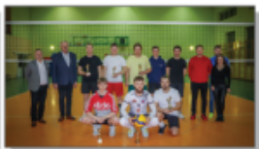
Pamiątkowa fotografia zwycięzcami II kat. wiekowej