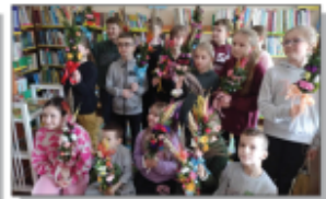
Warsztaty z klasą III ZSP w Batorzu