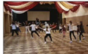
Warsztaty tańca Hip-hop