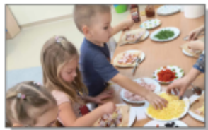
Dzień pizzy w przedszkolu

Nieco wcześniej przedszkolaki obchodzili też „Dzień Pizzy”. Tego dnia miały okazję zobaczyć, jak powstaje ten włoski przysmak i możliwość indywidualnego stworzenia pizzy z uwzględnieniem własnych gustów smakowych. Dzieci wykazały duże zdolności kulinarne. Nie tylko same raczyły się przygotowaną przez siebie potrawą, ale także każde dziecko zabrało kawałek zrobionej przez siebie pizzy do domu, aby poczęstować rodziców. Ci twierdzili, że była niezwykle smaczna.