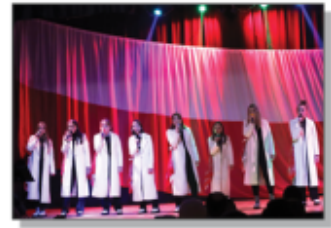
Zespół FENIX na scenie GOK