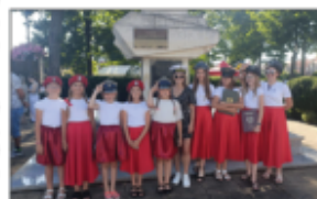
Isibiki w Modliborzycach