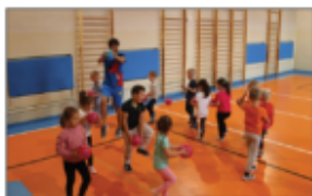
Zajęcia sportowe PRZEDSZKOLAKÓW

Pod koniec października uczniowie klasy 4 szkoły podstawowej otrzymali laptopy w ramach programu Ministerstwa Cyfryzacji „Laptop dla ucznia”. Po