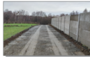
Droga w Błażku "za szkołą"