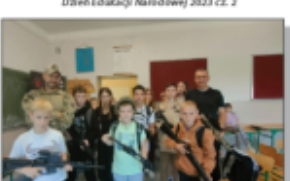
Spotkanie z emerytowanym żołnierzem Oddziału Specjalnego Żandarmerii Wojskowej w Warszawie, który był weteranem wojny w Iraku i Afganistanie