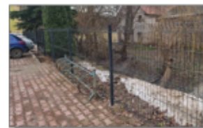
Ogrodzenie przy Zespole - Szkolno-Przedszkolnym

z przepisów opinii, zgód, uzgodnień i pozwoleń wraz z pozwoleniem na budowę oraz realizację budowlaną inwestycji. Termin wykonania 30 maja 2025 roku. Wartość robót przewidzianych do realizacji 4.248.159,02 zł Władze Gminy podpisały umowę z Urzędem Marszałkowskim Województwa z tego dofinansowanie z UM WL 2.226.656,00 zł.