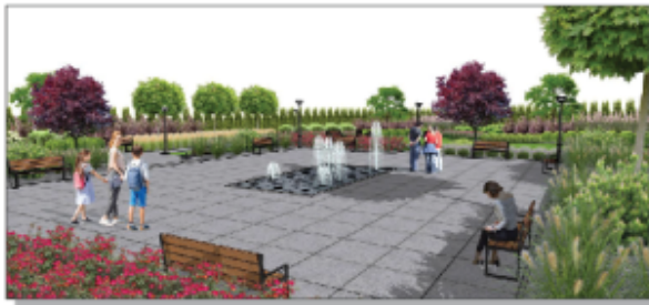
Wizualizacja projektu zagospodarowania centrum Batorza Pierwszego

Zadanie przewiduje dobudowanie nowego garażu do remizy OSP, co pozwoli na zaparkowanie nowego samochodu pożarniczego. Podjęte zostały kroki mające na celu uregulowanie statusu prawnego nieruchomości, na której ma powstać garaż - obecnie działka ta jest w posiadaniu osoby prywatnej. Kolejnym krokiem będzie ogłoszenie przetargu na realizację zadania.