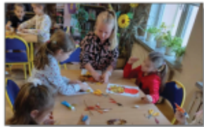
Jesiennie spotkania w Bibliotece

W naszej bibliotece podczas spotkań bibliotecznych zawsze czytamy książki i wykonujemy do nich różne