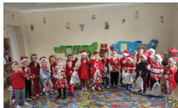
3- latki Smerfy

Po szczególnej informacji na temat pracy szkoły i przedszkola zainteresowanych czytelników zapraszamy na profil Publicznej Szkoły Podstawowej im. Marcina Borelowskiego- Lalewela w Batorzu w serwisie Facebook oraz na stronę internetową naszej szkoły, która znajduje się pod adresem: www.zsbatorz.pl .