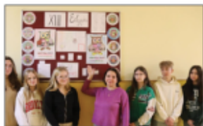
Świątyni Dzieci Tabliczki Mnożenia