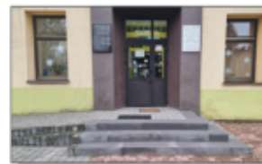
Schody przy budynku szkoły ZSP w Batorzu