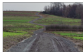
"Zamkowa droga" z nową nawierzchnią

W dniu 04 grudnia 2023 została zawarta umowa z firmą WOOD-BUD sp. z o.o. Kratnik na realizację zadania pn. Poprawa gospodarki wodno-ściekowej w Gminie Batorz, którego przedmiotem jest budowa sieci kanalizacyjnej i oczyszczalni ścieków w Batorzu Pierwszym. Zakres robót obejmuje wybudowanie 2.744 m kanalizacji sanitarnej, przebudowę 267 m istniejącego wodociągu oraz budowę oczyszczalni z obrotowym złożem biologicznym umożliwiającym odbiór 60m3 ścieków na dobę. Pozwoli to na odbiór ścieków z instytucji gminnych oraz od kiludziestciu posesji z części Batorza Pierwszego. Zakres umowy przewiduje sporządzenie projektu budowlanego i uzyskanie dla niego wynikających