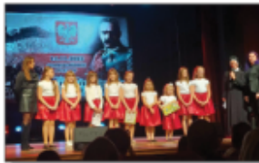
Iskierki w Janowie Lubelskim