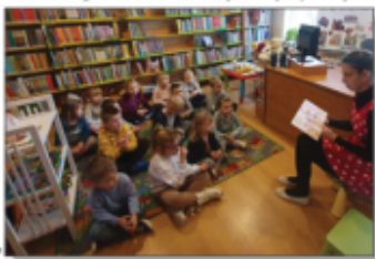
Jesiennie spotkania w Bibliotece

Na koniec dzieci mogły zamienić się w bajkowe postacie i zagrać w gry - budce! Zabawa była świetna!