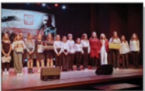
Zespół Teraz Wszyscy Razem