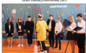
Dzień Edukacji Narodowej 2023 cz. 2