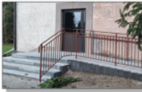
Schody i podjazd przy GOK w Batorzu