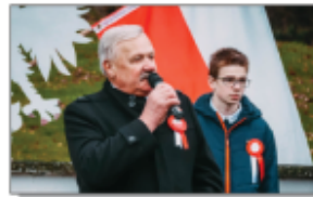
Wójt Gminy Batorz podczas tegorocznych obchodów Narodowego Święta Niepodległości