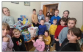
Zbiórka charytatywna dla dzieci „Ty możesz zostać Świętym Mikołajem 2023”