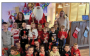
5- latki Piszczolki