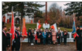
Młodzież z ZSP w Batorzu