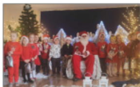
4- latki Sówki