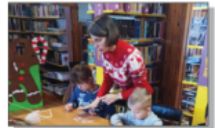
Warsztaty z klasą II ZSP w Batorze

Zabawa podczas warsztatów była świetna, a ozdoby wyszły przepięknie.