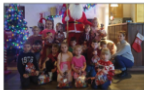
6- latki Morytki