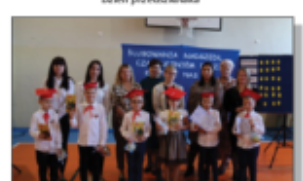
Ślubowanie Klasy I