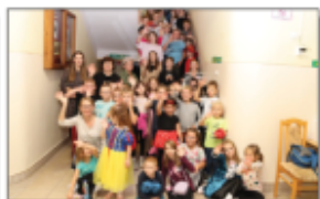
Noc biblioteki pod hasłem „Absurdnie czytać”

Praktycznym sprawdzianem życzliwości i wrażliwości była zbiórka charytatywna „I Ty możesz zostać świętym Mikołajem – ONKOKOŁAJ 2023”, podczas której dzieci wraz z rodzicami okazali swoje dobre serca przynosząc hojne prezenty dla oddziału onkologicznego Uniwersyteckiego Szpitala Dziecięcego w Lublinie. Kosz z podarunkami pękł w szwach. Nie po raz pierwszy uczniowie okazali