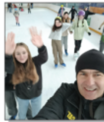
Wycieczka do Lublina z okazji Mikołajek 2023

Grudzień ze swoją piękną zimową sceną, wniósł do szkoły cudowny nastrój przedświąteczny, uczniowie ubierają klasowe choinki własnoręcznie wykonanymi bombkami i kolorowymi świeczkami. Cała szkoła społeczność angażuje się w przygotowania bożonarodzeniowych Jasełek, które są coroczną, piękną tradycją naszej szkoły.