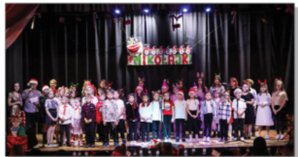
Koncert Mikołajkowy w GOK