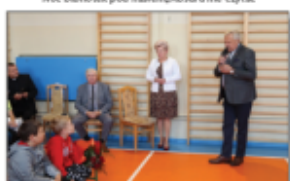
Dzień Edukacji Narodowej 2023