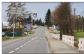
Odcinek drogi powiatowej naprzeciwko stołu