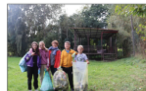
Akcja „Sprzątanie świata”