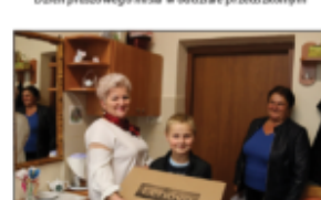
Przekazanie laptopów uczniom 4 klasy z programu „Laptop dla ucznia”