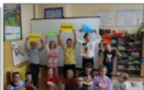
Świątyni Dzieci Owoców i Warzyw

Jak co roku, podczas oczekiwania na Święta Bożego Narodzenia wszyscy świętujemy Mikołajki. 6 grudnia, dzieci z naszej szkoły sbranie na czarowno i w pięknych czapkach mikołajkowych, nasłuchwały dzwoniących zwiastujących wizytę Świętego Mikołaja. Wszystkim udzielała się radość i ekscytacja. Gdy wreszcie wyczekiwany gość się pojawił, dzieci zaśpiewały piosenkę i wręczyły laurki dziękując św. Mikołajowi za upominki. Żegnając tak miłego gościa, maluchy rozpoczęły odliczanie do następnego spotkania.