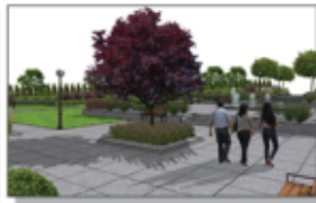
Wizualizacja projektu zagospodarowania centrum

PRZEBUDOWA SCHODÓW W BUDYNKU GOK W ramach zadania wykonano remont schodów prowadzących do budynku Gminnego Ośrodka Kultury w Batorzu.