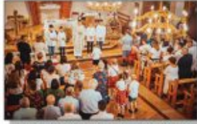
Uroczysta Msza Święta podczas Dożynek w Białku

Od 15 sierpnia do 27 września odbywały się dożynki w poszczególnych parafiach znajdujących na terenie naszej gminy. 15 sierpnia spotkali się na święcie płonów w Kościele pw. Zesłania Ducha Świętego w Białku. Tam też za zebrane plony dziękowali członkowie korowódów z Białki i Nowych Moczydł. W niedzielę 20 sierpnia podczas Mszy Świętej w Kościele Parafialnym Najświętszego Serca Pana Jezusa barwny wieniec przyniśli mieszkańcy Aleksandrówki. Ostatnie w tym roku dożynki parafialne odbyły się w Kościele pw. Pana Jezusa Dobrego Pasterza w Stawcach 27 sierpnia 2023.