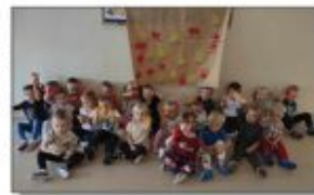
Smerfy - Dzień Przedszkolaka