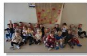
Smerfy - Dzień Przedszkolaka