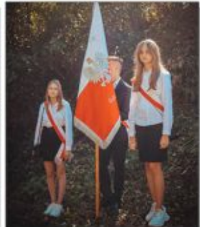
Poczet Szkoła Publicznej Szkoły Podstawowej w Batorzu