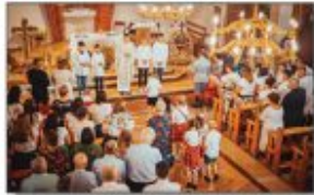
Uroczysta Msza Święta podczas Dożynek w Białku

Od 15 sierpnia do 27 września odbywały się dożynki w poszczególnych parafiach znajdujących na terenie naszej gminy. 15 sierpnia spotkali się na święcie płonów w Kościele pw. Zesłania Ducha Świętego w Białku. Tam też za zebrane plony dziękowali członkowie korowódów z Białki i Nowych Moczydł. W niedzielę 20 sierpnia podczas Mszy Świętej w Kościele Parafialnym Najświętszego Serca Pana Jezusa barwny wieniec przyniśli mieszkańcy Aleksandrówki. Ostatnie w tym roku dożynki parafialne odbyły się w Kościele pw. Pana Jezusa Dobrego Pastora w Stawcach 27 sierpnia 2023.