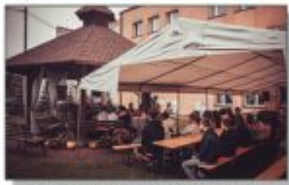
Atena, w której odbywał się Narodowe Czytanie

Podczas tegorocznego Narodowego Czytania z całej obszerności tego 3-tomowego dzieła wybraliśmy do czytania fragmenty bezpośrednio odnoszące się do Powstania Styczniowego, którego obchodzimy w tym roku 160 rocznicę. Jest ono szczególnie dla nas ważne, ponieważ my także mamy swoją drogą powstania styczniowych, tak samo jak bohaterowie tej powieści. I tak samo jak oni dbamy o to miejsce, zachowujemy je