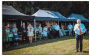
Przebranie Włóżki Gminy w Białku

W sobotę 26 sierpnia 2023 mimo upału i doświadczonego słońca na terenie kompleksu sportowo rekreacyjnego w Batorze Pierwszym zebrali się Korowody Dożynekowe z sołectw naszej gminy. Mieszkańcy przyszli licznie, by wspólnie z rolnikami świętować zakończenie tegorocznych zbiorów.