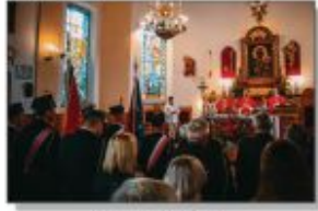
Uroczysta Msza święta