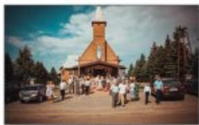
Dożynki w Aleksandrówce