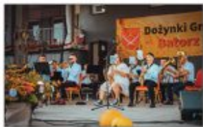
Orkiestra Dęta z Batorza

Na scenie nie zabrakło tego dnia muzycznych wrażeń. Kola Gospodyń Wiejskich przygotowały stoiska gastronomiczne. Na murawie można było spotkać Bychawską Grupę Motocyklową „MOTOPODKOŁA”, a nocą zaprezentowany został pokaz laserowy.