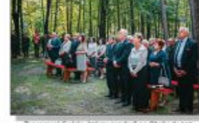
Zaproszeni Goście. Kłazy przybyli na Obchody 160. Rocznicy Powstania Styczniowego i Bitwy pod Batorzem