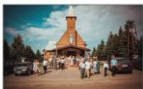
Dożynki w Aleksandrówce