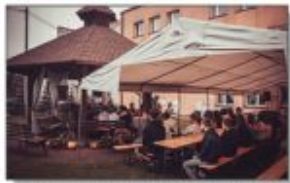
Afana, w której odbywał się Narodowe Czytanie

Podczas tegorocznego Narodowego Czytania z całej obszerności tego 3-tomowego dzieła wybraliśmy do czytania fragmenty bezpośrednio odnoszące się do Powstania Styczniowego, którego obchodzimy w tym roku 160 rocznicę. Jest ono szczególnie dla nas ważne, ponieważ my także mamy swoją drogą powstania styczniowych, tak samo jak bohaterowie tej powieści. I tak samo jak oni dbamy o to miejsce, zachowujemy je