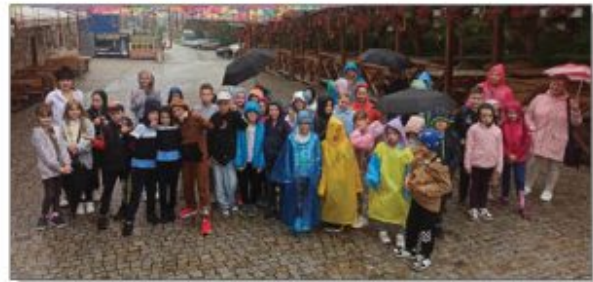
Paniąkowa fotografia uczniów wraz z opiekunami wykonana podczas wycieczki w Góry Świętokrzyskie