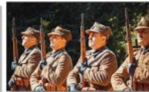
Członkowie Grupy Rekonstrukcyjno - Historycznej im. Zieleniewskiego z Majdanu Obleszce