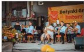
Orkiestra Dęta z Batorza

Na scenie nie zabrakło tego dnia muzycznych wrażeń. Kola Gospodyni Wielkich przygotowały stoiska gastronomiczne. Na murawie można było spotkać Bychawską Grupę Motocyklową "MOTOPODKOŁA", a nocą zaprezentowany został pokaz laserowy.