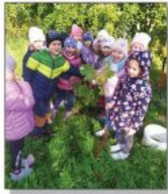
Motyłki prowadziły kłosa

Szkola i przedszkole to miejsce tętniące życiem, działaniem, zapalem i energią młodych ludzi i zaangażowanych nauczycieli.