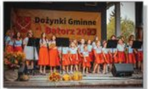
Zespół Muzyczny "Teraz Wszystko Razem"