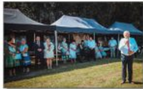
Przebieranie Włosa Gminy w Białku

W sobotę 26 sierpnia 2023 mimo upału i doświadczonego słońca na terenie kompleksu sportowo rekreacyjnego w Batorze Pierwszym zebrali się Korowody Dożynekowe z sołectw naszej gminy. Mieszkańcy przyszli licznie, by wspólnie z rolnikami świętować zakończenie tegorocznych zbiorów.