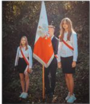
Poczet Sztabowej Publicznej Szkoły Podstawowej w Batorzu