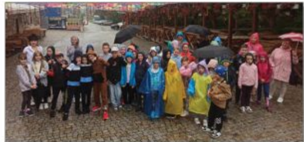
Paniąkowa fotografia uczniów wraz z opiekunami wykonana podczas wycieczki w Góry Świętokrzyskie