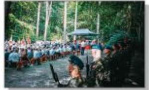
Msza Święta w lesie

Młodzież z Zespołu Szkolno-Przedszkolnego w Batorzu zaprezentowała montaż słowno-muzyczny, po czym delegacja złożyła wieniec przy Kopcu Marcina Borełowskiego „Lelwela” oraz przy mogile Powstańców na cmentarzu parafialnym w Batorzu.