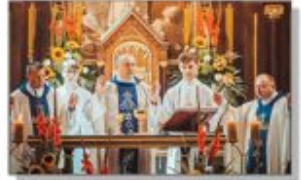
Księża podczas Mszy Św. Dziękczynnej