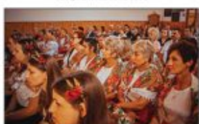
Fotografia z Mszy Św. Dożynekowej w Stawcach

Kolejnym punktem programu była prezentacja korowodów dożynekowych. Starostami byli: