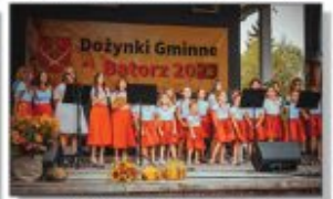
Zespół Muzykany "Teraz Wszystko Razem"