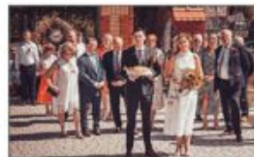
Starostowie Gminy Dożynek