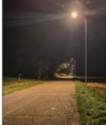
Nowo stworzone oświetlenie uliczne przy drodze Stawce - Wola Studzińska Kolonia

dofinansowania z BGK w wysokości 95 % wartości inwestycji drogowych. Trwają prace związane z realizacją inwestycji pn. Wykonanie linii kablowej wydzielonej oraz modernizacja istniejącego systemu oświetlenia ulicznego na terenie Gminy Batorz. W pierwszej kolejności wykonano nową linię kablową oświetlenia ulicznego w miejscowościach: Stawce - Kolonia, Wola Studzińska, Batorz - Kolonia oraz pomiędzy Stawkami, a Wólą Studzińską Kolonia. Obecnie w pozostałych miejscowościach gminy, trwa wymiana lamp oświetleniowych na ledowe. Termin zakończenia inwestycji: koniec października 2023.