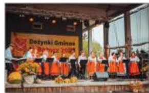
Grupa Soliste Song