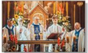
Kapela podczas Mszy Św. Dożynekowej