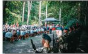
Msza Święta w lesie