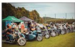
Bychawska Grupa Motocyklowa "MOTOPODKOŁA"