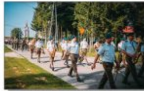
Przemarsz na miejsce uroczystości