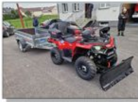
Quad wraz z przyczepką i wyposażeniem przed budynkiem OSP KSRG w Aleksandrowce

Wielkim wyróżnieniem dla OSP KSRG Aleksandrowka jest otrzymanie jednego z pojazdów typu quadra spośród tych, które zostały skierowane na teren powiatu janowskiego. Na terenie naszego powiatu wozy otrzymały również: OSP Czerzanów, OSP Dzwola, OSP Godziszów II oraz OSP Pustk Wielki. Na teren powiatu kraśnickiego trafiło 8 quadrow do jednostek: OSP Błinów, OSP Boby Wiel, OSP Goticzów Folewark, OSP Lińsk Duży, OSP Szczotka Stacja, OSP Trzydnik Duży, OSP Wilkóz, OSP Zakrzówek. Na teren powiatu opolskiego trafiło 5 quadrow do jednostek: OSP Boiska Kolonia z gm. Józefów nad Wisłą, OSP Braciejowice, OSP Noworóżów, OSP Poniatoła OSP Puszczo Godowlina.