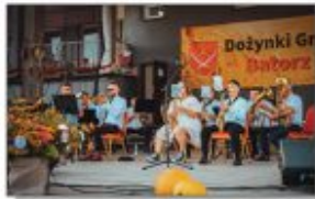
Orkiestra Dęta z Batorza

Na scenie nie zabrakło tego dnia muzycznych wrażeń. Kola Gospodyni Wielkich przygotowały stoiska gastronomiczne. Na murawie można było spotkać Bychawską Grupę Motocyklową „MOTOPODKOŃ”, a nocą zaprezentowany został pokaz laserowy.