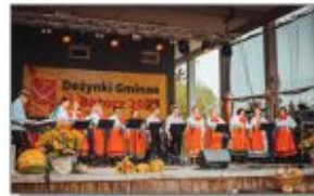
Grupa Soliste Song