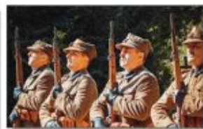
Członkowie Grupy Rekonstrukcyjno - Historycznej im. Zieleniewskiego z Majdanu Obleszce

wrócić do Ojczyzny. Dnia 24.06.1947 r. zarejestrował się w punkcie przyjęcia Gdańsk – Port skąd udał się do Batorza. Do rezerwy został przeniesiony 10 grudnia 1949 r. zaś 1 stycznia 1957 r. został zwolniony od powszechnego obowiązku wojskowego. Po powrocie z wojska pracował na niewielkim gospodarstwie rolnym wraz z żoną. Wspominał, iż mimo zaznania tułaczki, wielu krzywd i nieszczytę nigdy nie zakwał powrotu do kraju, tu znalazł spokój, którego brakowało za granicą. Tutaj był jego dom. Zmarł 10 stycznia 1973 r. w wieku 66 lat.