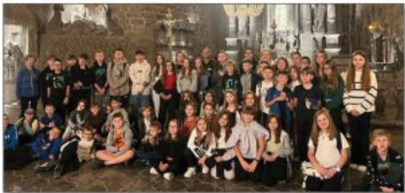
Paniąkowa fotografia uczniów wraz z opiekunami wykonana w Wierzbowicach

Szkola i przedszkole to miejsce tętniące życiem, działaniem, zapalem i energią młodych ludzi i zaangażowanych nauczycieli.