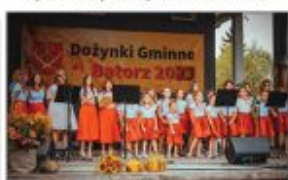
Zespół Muzyczny "Teraz Wszystko Razem"