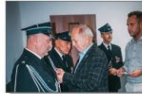
Debakacja medalami za zasługi dla Województwa Lubelskiego