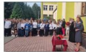
Reapoczęcie nowego roku szkolnego