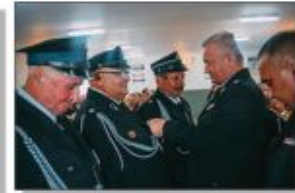
Debakacja medalami za zasługi dla potarniczewa