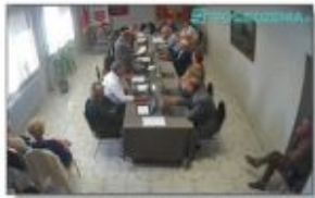
XXXVII Sesja Rady Gminy Batorz