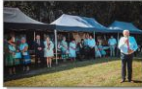
Przebranie Włóżki Gminy w Białku

W sobotę 26 sierpnia 2023 mimo upału i doskwierającego słońca na terenie kompleksu sportowo rekreacyjnego w Batorze Pierwszym zebrali się Korowody Dożynekowe z sołectw naszej gminy. Mieszkańcy przyszli licznie, by wspólnie z rolnikami świętować zakończenie tegorocznych zbiorów.