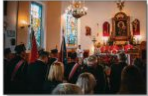
Uroczysta Msza święta