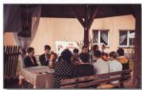
Uczniowie i nauczyciele podczas czytania Nad Niemenem