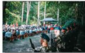
Msza Święta w lesie

Młodzież z Zespołu Szkolno-Przedszkolnego w Batorzu zaprezentowała montaż słowno-muzyczny, po czym delegacja złożyła wieniec przy Kopcu Marcina Borełowskiego „Lelwela” oraz przy mogile Powstańców na cmentarzu parafialnym w Batorzu.