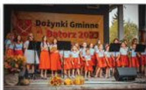
Zespół Muzykany "Teraz Wszystko Razem"