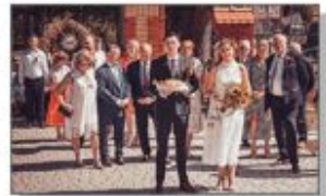
Starostwie Gminne Dożynek