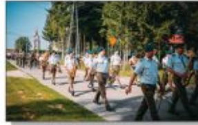
Przemarsz na miejsce uroczystości