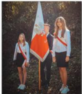
Poczet Szkoły Podstawowej w Batorzu