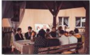
Uczniowie i nauczyciele podczas czytania Nad Niemenem