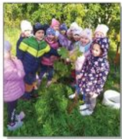
Motyłki goszwały kłosa

Paniąkowa fotografia uczniów wraz z opiekunami wykonana w Wierzbowicach