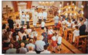
Uroczysta Msza Święta podczas Dożynek w Białku

Od 15 sierpnia do 27 września odbywały się dożynki w poszczególnych parafiach znajdujących na terenie naszej gminy. 15 sierpnia spotkali się na święcie płonów w Kościele pw. Zesłania Ducha Świętego w Białku. Tam też za zebrane plony dziękowali członkowie korowódów z Białki i Nowych Moczydł. W niedzielę 20 sierpnia podczas Mszy Świętej w Kościele Parafialnym Najświętszego Serca Pana Jezusa barwny wieniec przyniśli mieszkańcy Aleksandrówki. Ostatnie w tym roku dożynki parafialne odbyły się w Kościele pw. Pana Jezusa Dobrego Pastora w Stawcach 27 sierpnia 2023.