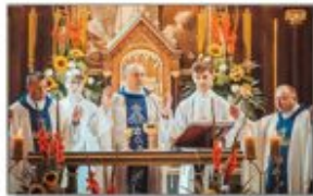
Msza podczas Mszy Św. Dożynekowej