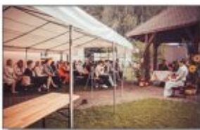
Wiadomia i uczestnicy Narodowego Czytania