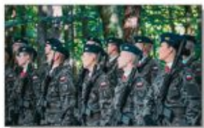
Żołnierze 16. Lubelskiej Brygady Zmechanizowanej