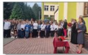
Witanie nowego roku szkolnego