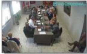
XXXVII Sesja Rady Gminy Batorz