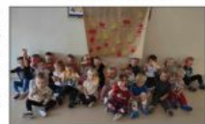
Smerfy - Dzień Przedszkolaka