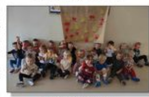
Smery - Dzień Przedszkolaka