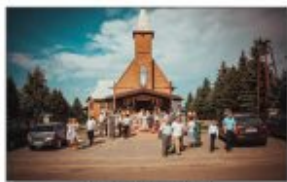
Dożynki w Aleksandrówce