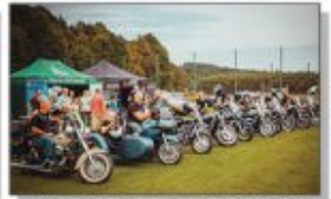
Bychawska Grupa Motocyklowa "MOTOPODKOŁA"