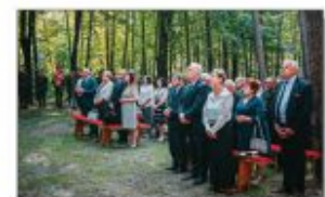
Zaproszeni Goście. Kłazy przybyli na Obchody 160. Rocznicy Powstania Styczniowego i Bitwy pod Batorzem