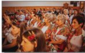
Fotografia z Mszy Św. Dożynekowej w Stawcach