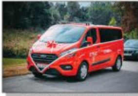
Nowy samochód specjalny dla OSP Węglinek