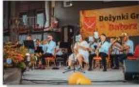
Orkiestra Dęta z Batorza

Na scenie nie zabrakło tego dnia muzycznych wrażeń. Kola Gospodyni Wielkich przygotowały stoiska gastronomiczne. Na murawie można było spotkać Bychawską Grupę Motocyklową „MOTOPODKOŁA”, a nocą zaprezentowany został pokaz laserowy.