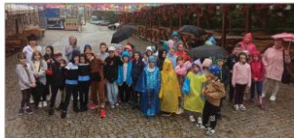
Paniąkowa fotografia uczniów wraz z opiekunami wykonana podczas wycieczki w Góry Świętokrzyskie