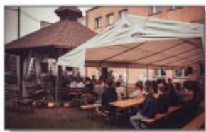
Afana, w której odbywał się Narodowe Czytanie

Podczas tegorocznego Narodowego Czytania z całej obszerności tego 3-tomowego dzieła wybraliśmy do czytania fragmenty bezpośrednio odnoszące się do Powstania Styczniowego, którego obchodzimy w tym roku 160 rocznicę. Jest ono szczególnie dla nas ważne, ponieważ my także mamy swoją drogą powstania styczniowych, tak samo jak bohaterowie tej powieści. I tak samo jak oni dbamy o to miejsce, zachowujemy je