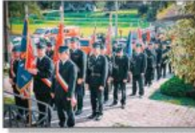
Porczy sztandarowe przed poświęceniem w Studziankach