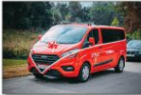
Nowy samochód specjalny dla OSP Węglinek