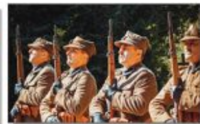
Członkowie Grupy Rekonstrukcyjno - Historycznej im. Zieleniewskiego z Majdanu Obleszce