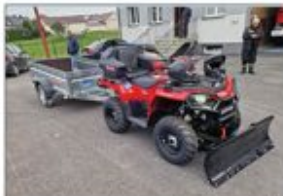
Quad wraz z przyczepką i wyposażeniem przed budynkiem OSP KSRG w Aleksandrowce

Wielkim wyróżnieniem dla OSP KSRG Aleksandrowka jest otrzymanie jednego z pojazdów typu quad spośród tych, które zostały skierowane na teren powiatu janowskiego. Na terenie naszego powiatu wozy otrzymały również: OSP Czerzany, OSP Dzwola, OSP Godziszów II oraz OSP Pustk Wielki. Na teren powiatu kraśnickiego trafiło 8 quadów do jednostek: OSP Błinów, OSP Boby Wiel, OSP Goticzów Folewark, OSP Lińsk Duży, OSP Szmatarka Stacja, OSP Trzydnik Duży, OSP Wilkóz, OSP Zakrzówek. Na teren powiatu opolskiego trafiło 5 quadów do jednostek: OSP Boiska Kolonia z gm. Józefów nad Wisłą, OSP Braciejowice, OSP Noworóżów, OSP Poniatowa OSP Puszo Godowlina.