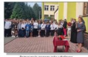
Reapoczęcie nowego roku szkolnego