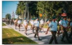
Przemarsz na miejsce uroczystości

W wyniku bitwy oddział „Lelwela” został całkowicie rozбит. Zginęło 38 powstańców w tym sam Borełowski, 47 zostało rannych. Polegli zostali