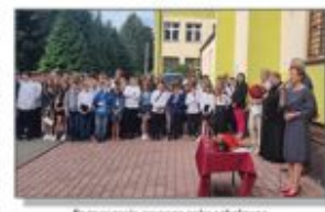
Witanie nowego roku szkolnego