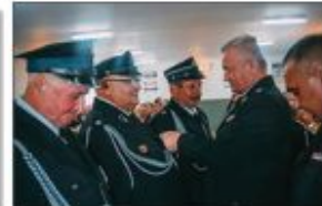
Debakacja medalami za zasługi dla potarniczewa