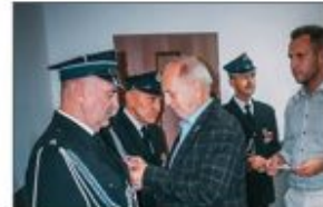
Debakacja medalami za zasługi dla Województwa Lubelskiego