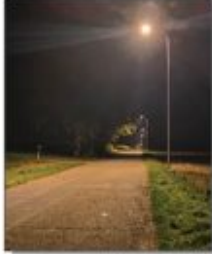
Nowo stworzone oświetlenie uliczne przy drodze Stawce – Wola Studzińska Kolonia

dofinansowania z BGK w wysokości 95 % wartości inwestycji drogowej. Trwają prace związane z realizacją inwestycji pn. Wykonanie linii kablowej wydzielonej oraz modernizacja istniejącego systemu oświetlenia ulicznego na terenie Gminy Batorz. W pierwszej kolejności wykonano nową linię kablową oświetlenia ulicznego w miejscowościach: Stawce – Kolonia, Wola Studzińska, Batorz – Kolonia oraz pomiędzy Stawkami, a Wólą Studzińską Kolonią. Obecnie w pozostałych miejscowościach gminy, trwa wymiana lamp oświetleniowych na ledowe. Termin zakończenia inwestycji: koniec października 2023.