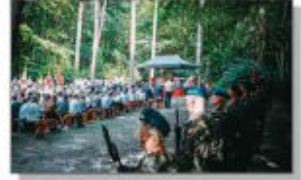
Msza Święta w lesie

Obchody 160. Rocznicy Powstania Styczniowego i Bitwy pod Batorzem miały miejsce 9 września 2023 roku. Rozpoczęte zostały przemarszem uczestników na miejsce uroczystości - Kopiec w lesie wystuowany około 1 km od centrum Batorza Pierwszego.