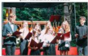
Uczniowie ZSP w Batorzu