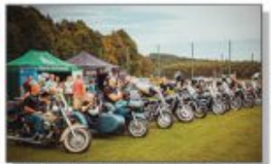
Bychawska Grupa Motocyklowa "MOTOPODKOŃ"