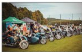
Bychawska Grupa Motocyklowa "MOTOPODKOŁA"