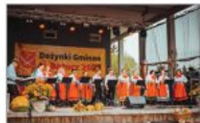
Grupa Solstice Song