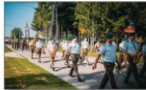
Przemarsz na miejsce uroczystości