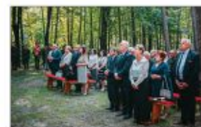
Zaproszeni Goście. Kłazy przybyli na Obchody 160. Rocznicy Powstania Styczniowego i Bitwy pod Batorzem