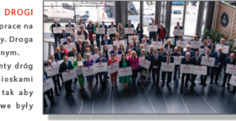
Wkręcanie umów o przyznanie pomocy finansowej dla Gmin w Lubelskim Centrum Konferencyjnym

Rejonowego w Janowie Lubelskim wniosek o przejęcie na własność Gminy mostów znajdujących się na rzece Por.