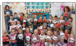
Zabawki od Wójta Gminy Batorz dla przedszkolaków