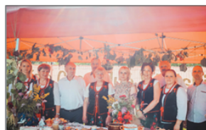
Wicewojewoda Lubelski B. Gzik oraz Władze Gminy Batorz z Członkami KGW Czeremcha z Samar

Fundusz Sprawiedliwości realizuje swoje działania również poprzez edukację i promocję. Starając się trafić do różnych grup społecznych, które oddziałują na lokalne społeczności, dzięki temu przekazując informacje o swojej działalności w zakresie pomocy osobom pokrzywdzonym, ale co równie istotne – zapobiegania sytuacjom, w których dochodzi do przestępstwa. Celem takich plenerowych wydarzeń jest nie tylko przybliżenie tematu, ale przede wszystkim dotarcie do osób narażonych na przemoc lub inne przestępstwa. Cieszymy się, że mogliśmy się wspólnie spotkać na tym wyjątkowym wydarzeniu. Miejmy nadzieję, że wpłynie ono na poprawę bezpieczeństwa mieszkańców naszej gminy, ale również wesprze rozwój społeczeństwa obywatelskiego.