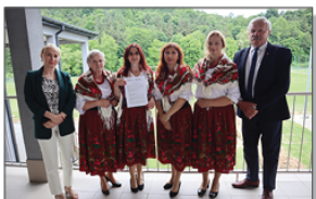
KGW Aleksandrowianki w Aleksandrowce

Pierwszą imprezą, którą Koła zorganizowały przy wykorzystaniu zakupionego sprzętu AGD był Piknik Rodzinny pn. Bezpieczny Batorz, który odbył się 25 czerwca 2023 roku na Kompleksie sportowo-rekreacyjnym.