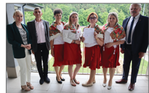
KGW Roztoczanki w Stawcach