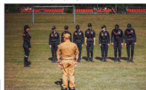
Musztra w wykonaniu Kobiecej Drużyny Pożarniczej