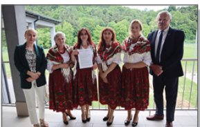
KGW Aleksandrowianki w Aleksandrowce

Pierwszą imprezą, którą Koła zorganizowały przy wykorzystaniu zakupionego sprzętu AGD był Piknik Rodzinny pn. Bezpieczny Batorz, który odbył się 25 czerwca 2023 roku na Kompleksie sportowo-rekreacyjnym.