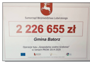
Czek dla Gminy Batorz na Operację typu "Gospodarka wodno-ściekowa" w ramach PROW 2014-2020

Aktualnie przygotowывается dokumentacja przetargowa na wybór wykonawcy zadania. Gmina złożyła wniosek o dofinansowanie ze