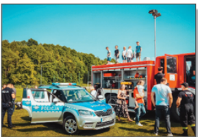
Piknik Rodzinny pn. Bezpieczny Batorz

W ramach dotacji został zakupiony nowy sprzęt AGD dla KGW, dzięki któremu koła mogły zorganizować Piknik Rodzinny „Bezpieczny Batorz”, podczas którego mieszkańcy gminy mogli porozmawiać z przedstawicielami służb bezpieczeństwa i poszerzyć swoją wiedzę z zakresu pierwszej pomocy, ruchu drogowego, zapobiegania oszustwom, których ofiarami padają osoby starsze, przeciwdziałania przestępstwom na szkodę dzieci, przeciwdziałania przemocy domowej, bezpieczeństwa społeczności lokalnych, bezpiecznego korzystania z Internetu