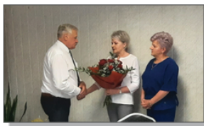
Gratulacje od Kierowników Jednostek Organizacyjnych

Gminy Batorz na lata 2023-2026, określenia zasad udzielania dotacji celowej na prace konserwatorskie, restauratorskie i roboty budowlane przy zabytku wpisanym do rejestru zabytków lub znajdującym się w wojewódzkiej lub gminnej ewidencji zabytków, położonym na obszarze Gminy Batorz, określenia wymagań, jakie powinien spełniać przedsiębiorca ubiegający się o uzyskanie zezwolenia na prowadzenie działalności w zakresie opróżniania zbiorników bezodpływowych lub osadników w instalacjach przydomowych oczyszczalni ścieków i transportu nieczystości ciekłych na terenie Gminy Batorz, określenia wysokości opłat za korzystanie z wychowania przedszkolnego dzieci objętych wychowaniem przedszkolnym do końca roku szkolnego w roku kalendarzowym, w którym kończą 6 lat w prowadzonym przez Gminę Batorz Publicznym Przedszkolu i oddziale przedszkolnym w Publicznej Szkole Podstawowej, wyrażenia zgody na sprzedaż w drodze przetargu nieograniczonego budynku po byłej Szkole Podstawowej w Aleksandrówce, wyrażenia woli kontynuacji Członkostwa Gminy Batorz w Stowarzyszeniu Lokalna Grupa Działania „Leśny Krag” z siedzibą w Janowie Lubelskim w okresie programowania PROW 2023-2027, rozpatrzenia petycji w sprawie podjęcia działań do uregulowania stanu prawnego nieruchomości położonej w Gminie Batorz.