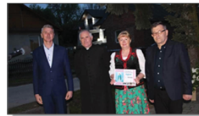
Spotkanie z Pieśnią Maryjną w Potoku Wielkim