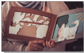
Jedna z książek wykonana przez uczniów klasy II