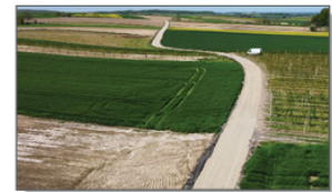
Prace przygotowawcze pod przebudowę drogi wewnętrznej Wola Studzińska - "Batorka"

Wszystkie zadania drogowe zostały zrealizowane i rozliczone. Gmina otrzymała dofinansowanie z BGK w wysokości 95 % wartości inwestycji drogowych. Obecnie realizowana jest inwestycja pn. Wykonanie linii kablowej wydzielonej oraz modernizacja istniejącego systemu oświetlenia ulicznego na terenie Gminy Batorz. Aktualnie wykonywana jest linia kablowa oświetlenia ulicznego w miejscowościach: Stawce, Stawce – Kolonia i Wola Studzińska.