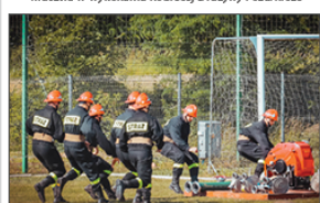
Ćwiczenia bojowe w wykonaniu jednostki Ochotniczej Straży Pożarnej z Batorza