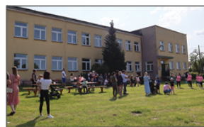
Piknik Rodzinny z KGW Aleksandrowianki

Wystąpiły dzieci i młodzież z GOK. Dla dzieci zorganizowane zostały gry i zabawy z animatorem, wata cukrowa, kielbaski i słodki stół i inne atrakcje.