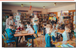
Tydzień Bibliotek z uczniami klasy "0"