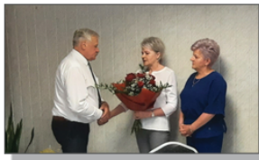
Gratulacje od Kierowników Jednostek Organizacyjnych

Gminy Batorz na lata 2023-2026, określenia zasad udzielania dotacji celowej na prace konserwatorskie, restauratorskie i roboty budowlane przy zabytku wpisanym do rejestru zabytków lub znajdującym się w wojewódzkiej lub gminnej ewidencji zabytków, położonym na obszarze Gminy Batorz, określenia wymagań, jakie powinien spełniać przedsiębiorca ubiegający się o uzyskanie zezwolenia na prowadzenie działalności w zakresie opróżniania zbiorników bezodpływowych lub osadników w instalacjach przydomowych oczyszczalni ścieków i transportu nieczystości ciekłych na terenie Gminy Batorz, określenia wysokości opłat za korzystanie z wychowania przedszkolnego dzieci objętych wychowaniem przedszkolnym do końca roku szkolnego w roku kalendarzowym, w którym kończą 6 lat w prowadzonym przez Gminę Batorz Publicznym Przedszkolu i oddziale przedszkolnym w Publicznej Szkole Podstawowej, wyrażenia zgody na sprzedaż w drodze przetargu nieograniczonego budynku po byłej Szkole Podstawowej w Aleksandrówce, wyrażenia woli kontynuacji Członkostwa Gminy Batorz w Stowarzyszeniu Lokalna Grupa Działania „Leśny Krag” z siedzibą w Janowie Lubelskim w okresie programowania PROW 2023-2027, rozpatrzenia petycji w sprawie podjęcia działań do uregulowania stanu prawnego nieruchomości położonej w Gminie Batorz.