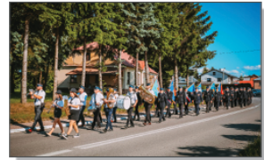
Przebieganie kolumny, z orkiestrą na czele, na terenie kompleksu sportowo-rekreacyjnego w Batorzu