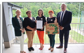
KGW Malina w Błażku

W poniedziałek 12 czerwca na Kompleksie Sportowo-Rekreacyjnym w Batorzu odbyło się uroczyste przekazanie sprzętu AGD Kół Gospodyń Wiejskich z terenu gminy, zakupionego w ramach projektu „Piknik Rodzinny pn. Bezpieczny Batorz”. Projekt został zfinansowany ze środków Funduszu Sprawiedliwości, którego dysponentem jest Minister Sprawiedliwości. Wartość dofinansowania wyniosła 20.000,00 zł. Sprzęt gastronomiczny został odebrany przez członkinie i członków ze wszystkich 6 Kół Gospodyń Wiejskich z terenu naszej gminy, tj.: