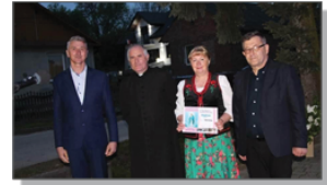
Spotkanie z Pieśnią Maryjną w Potoku Wielkim