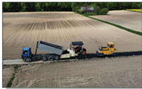
Przebudowa drogi w wewnętrznej Wola Studzińska - "Batorka"

Niebawem rozpoczną prace przy budowie linii kablowej w Batorzu Kolonii. W pozostałych miejscowościach gminy lampy zostaną wymienione na ledowe z oprzyrządowaniem i nowymi wysięgnikami. Termin zakończenia Inwestycji październik 2023.