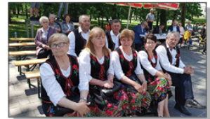
Festiwal Folkloru w Janowie Lubelskim