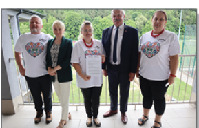
KGW Kalina z Roztocza