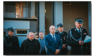
Przebieganie kolumny, z orkiestrą na czele, na terenie kompleksu sportowo-rekreacyjnego w Batorzu