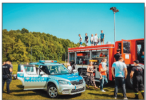
Piknik Rodzinny pn. Bezpieczny Batorz

W ramach dotacji został zakupiony nowy sprzęt AGD dla KGW, dzięki któremu koła mogły zorganizować Piknik Rodzinny „Bezpieczny Batorz”, podczas którego mieszkańcy gminy mogli porozmawiać z przedstawicielami służb bezpieczeństwa i poszerzyć swoją wiedzę z zakresu pierwszej pomocy, ruchu drogowego, zapobiegania oszustwom, których ofiarami padają osoby starsze, przeciwdziałania przestępstwom na szkodę dzieci, przeciwdziałania przemocy domowej, bezpieczeństwa społeczności lokalnych, bezpiecznego korzystania z Internetu