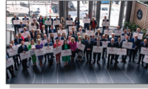
Wkręcanie umów o przyznanie pomocy finansowej dla Gmin w Lubelskim Centrum Konferencyjnym

Rejonowego w Janowie Lubelskim wniosek o przejęcie na własność Gminy mostów znajdujących się na rzece Por.