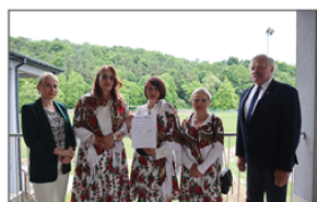
KGW Moczydłanki z Nowych Moczydł