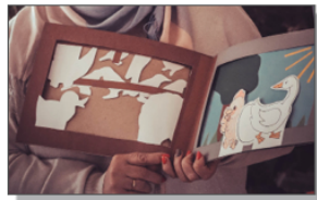
Jedna z książek wykonana przez uczniów klasy II