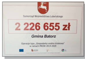
Czek dla Gminy Batorz na Operację typu "Gospodarka wodno-ściekowa" w ramach PROW 2014-2020

Aktualnie przygotowywana jest dokumentacja przetargowa na wybór wykonawcy zadania. Gmina złożyła wniosek o dofinansowanie ze