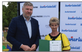
Pamiątkowa fotografia z uroczystego zakończenia etapu wojewódzkiego plebiscytu Mistrzowie Agro

Zakończyło się głosowanie w plebiscycie wiejskim i rolniczym "Mistrzowie Agro", który prowadzony był przez "Kurier Lubelski". Akcja ta prezentuje w gazecie, w internecie i w mediach społecznościowych, życie polskiej wsi i jej mieszkańców. Konkurs ten do doskonała okazja dla wiejskich społeczności, by docenić tych, którzy kształtują ich codzienne życie. Natomiast uczestnicy mają wyjątkową szansę, aby zaprezentować swoje dokonania w skali nie tylko województwa, ale również całego kraju. Tytuły są przyznawane najpierw w powiatach, później na szczeblu województwa, a następnie w skali całego kraju.