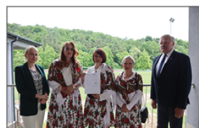
KGW Moczydłanki z Nowych Moczydł