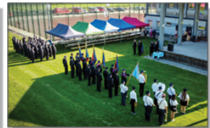
Gminne Obchody Dnia Strażaka w Batorzu