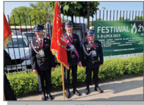
Poczet sztandarowy OSP Aleksandrówka podczas VIII Pielgrzymki Strażaków na Jasną Górę