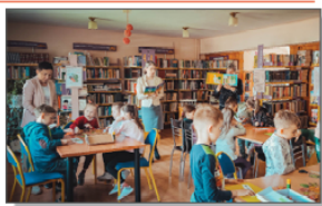
Tydzień Bibliotek z uczniami klasy "0"