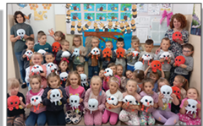
Zabawki od Wójta Gminy Batorz dla przedszkolaków