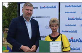
Pamiątkowa fotografia z uroczystego zakończenia etapu wojewódzkiego plebiscytu Mistrzowie Agro

Zakończyło się głosowanie w plebiscycie wiejskim i rolniczym "Mistrzowie Agro", który prowadzony był przez "Kurier Lubelski". Akcja ta prezentuje w gazecie, w internecie i w mediach społecznościowych, życie polskiej wsi i jej mieszkańców. Konkurs ten do doskonała okazja dla wiejskich społeczności, by docenić tych, którzy kształtują ich codzienne życie. Natomiast uczestnicy mają wyjątkową szansę, aby zaprezentować swoje dokonania w skali nie tylko województwa, ale również całego kraju. Tytuły są przyznawane najpierw w powiatach, później na szczeblu województwa, a następnie w skali całego kraju.