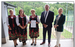
KGW Czeremcha w Samarach