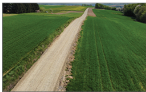
Prace przygotowawcze przebudowy drogi gminnej Wólka Batorska - Kolonia - Stawce