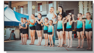
Występ Grupy Akrobatycznej „ARKA”