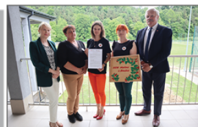
KGW Malina w Błażku

W poniedziałek 12 czerwca na Kompleksie Sportowo-Rekreacyjnym w Batorzu odbyło się uroczyste przekazanie sprzętu AGD Kół Gospodyń Wiejskich z terenu gminy, zakupionego w ramach projektu „Piknik Rodzinny pn. Bezpieczny Batorz”. Projekt został zfinansowany ze środków Funduszu Sprawiedliwości, którego dysponentem jest Minister Sprawiedliwości. Wartość dofinansowania wyniosła 20.000,00 zł. Sprzęt gastronomiczny został odebrany przez członkinie i członków ze wszystkich 6 Kół Gospodyń Wiejskich z terenu naszej gminy, tj.: