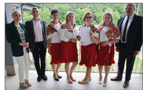
KGW Roztoczanki w Stawcach