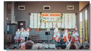
Pierwszy występ Zespołu „Mali Batorzanie”