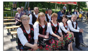
Festiwal Folkloru w Janowie Lubelskim