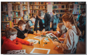
Warsztaty książki tunelowej z dziećmi z klasy III