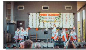
Pierwszy występ Zespołu „Mali Batorzanie”