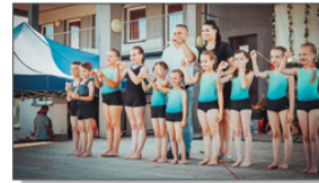
Występ Grupy Akrobatycznej „ARKA”