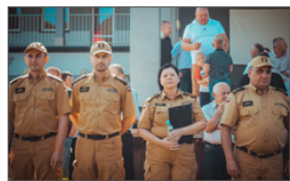
Zbiórka z okazji rozpoczęcia zawodów w Batorzu