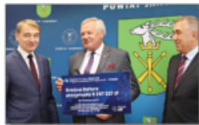
Czek dla Gminy Batorz (II nabór)