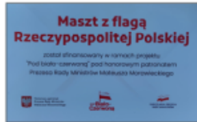
Tabliczka umieszczona przy maszcie

Podczas Gminnych Obchodów Narodowego Święta Niepodległości 11 listopada 2022 roku flaga została uroczystie podniesiona na maszt. Projekt zrealizowany został pod honorowym patronatem Prezesa Rady Ministrów Mateusza Morawieckiego.