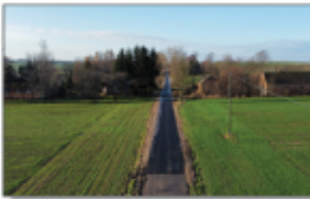
Zdjęcie 10: Droga Stawce Kolonia "do Sokola"