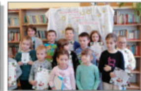
Mikolajkowy konkurs recytatorski