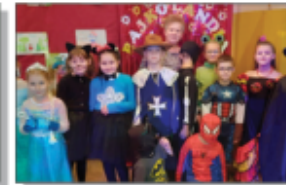
Dzień podręczni bajek