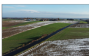
Droga Batorz - Gwizdów - Węglinek