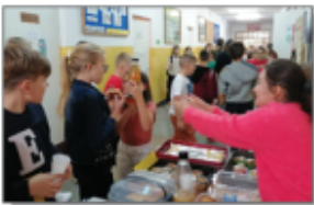
Światowy Dzień Jabłka