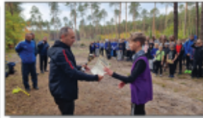
II miejsce w powiecie w dziesiątych biegach przełajowych chłopców