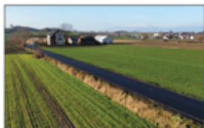
Droga w Batorzu - Kolonia