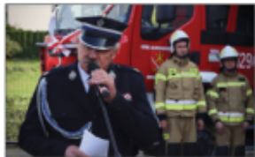
Przedwzięcie Wójta Gminy Batorz podczas przekazania samochodu dla OSP Aleksandrówka

Drugi wóz - lekki samochód pożarniczy marki Renault otrzymała Ochotnicza Straż Pożarna w Wólce Batorskiej. Finansowanie: - MSWiA: 200.000,00 zł, - Gmina Batorz: 122.700,00 zł. Uroczyste poświęcenie i przekazanie wozu zaplanowane zostało na styczeń 2023 roku.