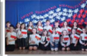
Apeł - Święto Odkrywania Niepodeległości