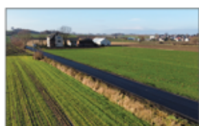
Droga w Batorzu - Kolonii