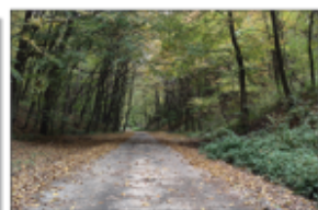
Droga wzdłuż Sowiej Góry