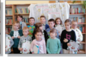
Mikołajkowy konkurs recytatorski