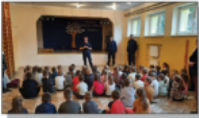
Bezpieczna droga do szkoły – spotkanie z policjantami