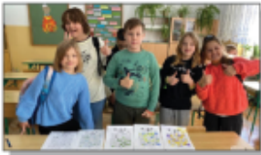
Światowy Dzień Tabliczek Mniejszości