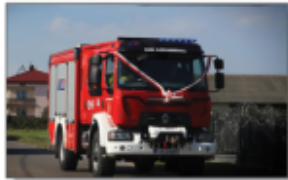
Samochód dla OSP Aleksandrówka