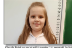
Klasa Bymk po recytacji (z pamięci) 31 zwrotek ballady Adama Mickiewicza „Pan Fawstowski”