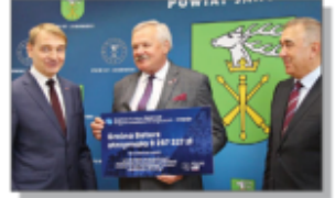
Czek dla Gminy Batorz (II nabór)