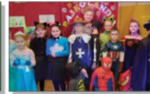
Dzień podręczni bajek