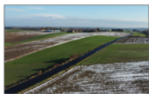
Droga Batorz - Gwizdów - Węglinek