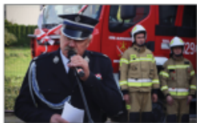
Przedwinięcie Wójty Gminy Batorz podczas przekazania samochodu dla OSP Aleksandrówka

Uroczyste poświęcenie i przekazanie wozu zaplanowane zostało na styczeń 2023 roku.