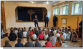
Bezpieczna droga do szkoły – spotkanie z policjantem