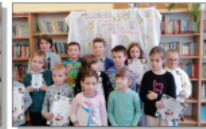
Mikolajkowy konkurs recytatorski