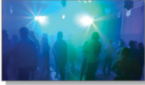
Dzień Chłopaka na nagłośnieniu i otwarceniu zakupionych w ramach programu Laboratoria Przyszłości