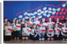
Apeł - Święto Odkrywania Niepodeległości