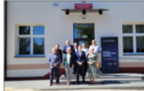
Odbiór budynku PSP w Błazku po termomodernizacji