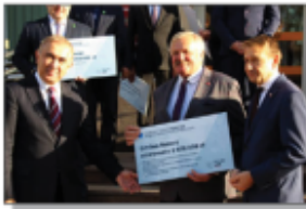
Odbiór symbolicznego czeka przez Wójta Gminy i radcę