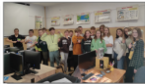
Światowy Dzień Zdrowia Psychicznego