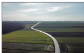
Droga Aleksandrówka - Wola Studzińska - Kolonia "Batorka"