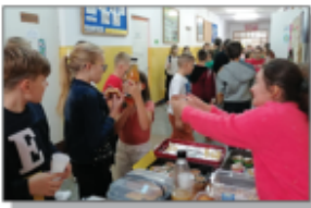
Światowy Dzień Jabłka