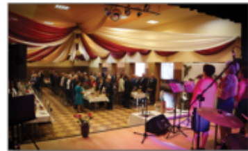
Uroczyste „Sto lat” w wykonaniu Kapeli Batorskiej