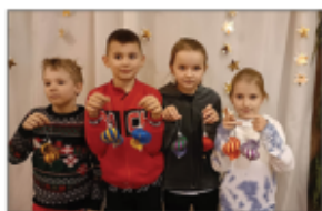
Uczniowie z ZSP w Batorzu