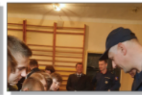
Jestem Ambasadorem Bezpieczeństwa