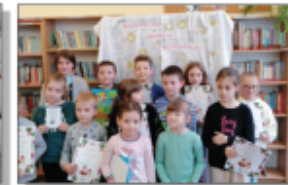
Mikolajkowy konkurs recytatorski