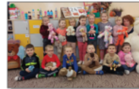
Dzień pluszowego misia