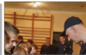
Jestem Ambasadorem Bezpieczeństwa