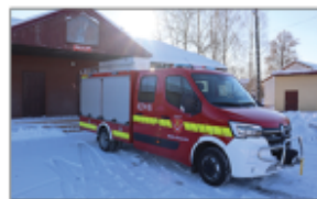
Wóz dla OSP Wólka Batorska