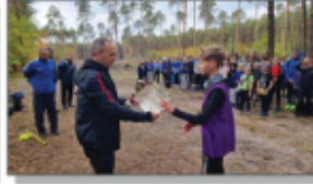
II miejsce w powiecie w dziesiątych biegach przełajowych chłopaków