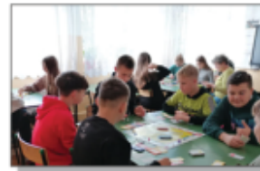
Solony Dzień Gier Planszowych