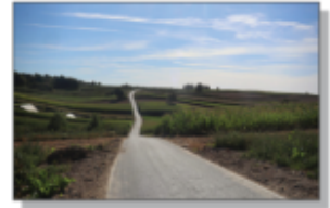
Droga Aleksandrówka - Batorz "za stodołami"