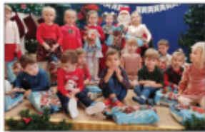
Mikołaj w szkole i przedszkolu w Batorzu