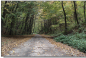
Droga wzdłuż Sowiej Góry