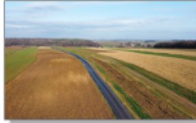
Zdjęcie 9: Droga Stawce - Stawce - Kolonia "Wyggon"

W projekcie obejmującym oświetlenie uliczne prace uzgodnione i techniczne są na ukończeniu. W miesiącu styczniu 2023 roku przeprowadzone zostanie postępowanie przetargowe celem wyłonienia wykonawcy robót. Na powyższe zadanie zabezpieczone zostały środki w budżecie gminy.