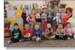
Dzień pluszowego misia