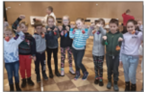
Warsztaty w GBP