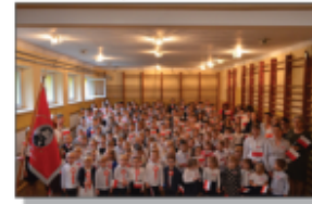
Szkoła do hymnu