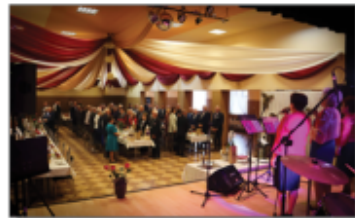
Uroczyste „Sto lat” w wykonaniu Kapeli Batorskiej