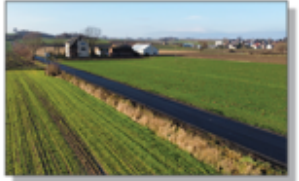
Droga w Batorzu - Kolonii