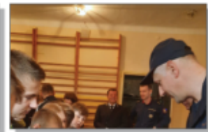
Jestem Ambasadorem Bezpieczeństwa