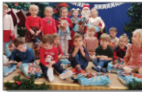
Mikołaj w szkole i przedszkolu w Batorzu