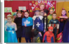
Dzień postaci bajek