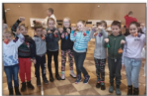
Warsztaty w GBP