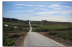
Droga Aleksandrówka - Batorz „za stodołami”