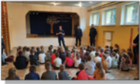
Bezpieczna droga do szkoły – spotkanie z policjantem