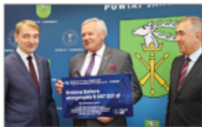
Czek dla Gminy Batorz (II nabór)