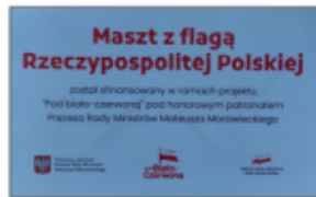
Tabliczka umieszczona przy maszcie

Podczas Gminnych Obchodów Narodowego Święta Niepodległości 11 listopada 2022 roku flaga została uroczystie podniesiona na maszt. Projekt zrealizowany został pod honorowym patronatem Prezesa Rady Ministrów Mateusza Morawieckiego.