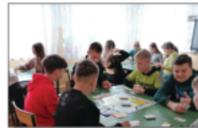
Solony Dzień Gier Planszowych

27 października 2022 w naszej szkole odbył się pokaz historyczny pt. „Konflikty XX wieku” przygotowany przez grupę „Patriotów”. W trakcie spotkania przybliżono uczniom tematykę wydarzeń II Wojny Światowej. Poza tym chętni uczniowie biali udział w bezopisowej demonstracji sprzętu oraz mundurów. Po zakończeniu pokazu, każdy mógł podejść do rekwizytów i z bliska zobaczyć jak zmieniła się broń na przestrzeni lat.