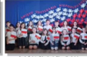
Apeł - Święto Odkrywania Niepodeległości