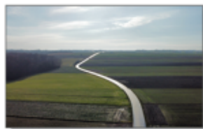
Droga Aleksandrówka - Wola Studzińska - Kolonia „Batorka”