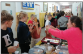
Światowy Dzień Jabłka