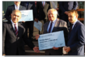
Odbiór symbolicznego czeka przez Wójta Gminy i radcę