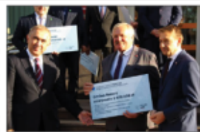
Odbiór symbolicznego czeku przez Wójta Gminy i radcę