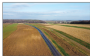
Zdjęcie 9: Droga Stawce - Stawce - Kolonia „Wygon”

W projekcie obejmującym oświetlenie uliczne prace uzgodnione i techniczne są na ukończeniu. W miesiącu styczniu 2023 roku przeprowadzone zostanie postępowanie przetargowe celem wyłonienia wykonawcy robót. Na powyższe zadanie zabezpieczone zostały środki w budżecie gminy.