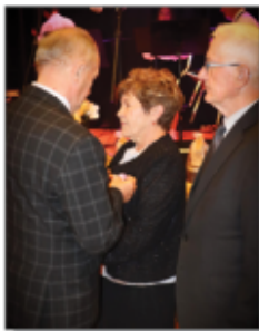
Akt dekoracji Jubilatów

Wszystkim parom gratulujemy i życzymy dużo zdrowia i miłości na kolejne, wspólne lata.