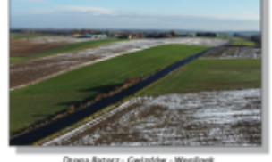
Droga Batorz - Gwizdów - Węglinek