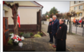
Złożenie kwiatów przy pomniku Józefa Piłsudskiego