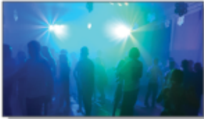
Dzień Chłopaka na nagłośnieniu i otwarceniu zakupionych w ramach programu Laboratoria Przyszłości