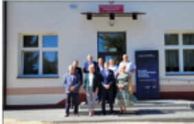
Odbiór budynku PSP w Białku po termomodernizacji