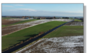
Droga Batorz - Gwizdów - Węglinek