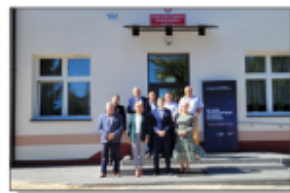
Odbiór budynku PSP w Białku po termomodernizacji