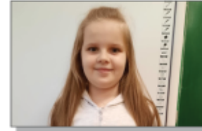
Klasyfikacja po recytacji (z pamięci) 31 zwrotek ballady Adama Mickiewicza „Pan Twardowski”