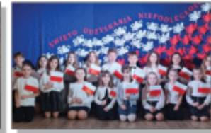
Apeł - Święto Odkrywania Niepodejętości