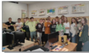
Światowy Dzień Zdrowia Psychicznego