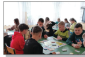
Solony Dzień Gier Planszowych