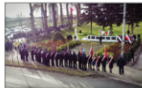
Przedwzięcie Wójta Gminy Batorz podczas Obchodów Narodowego Święta Niepodległości