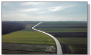
Droga Aleksandrówka - Wola Studzińska - Kolonia "Batorka"