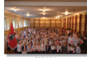
Szkoła do hymnu