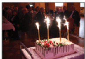
Tort dla dostojnych Jubilatów