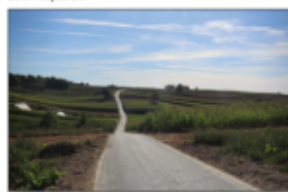
Droga Aleksandrówka - Batorz „za stodołami”