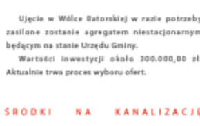
Ujęcie w Wólce Batorskiej w razie potrzeby zasilone zostanie agregatem niestacjonarnym będącym na stanie Urzędu Gminy.

Gmina Batorz otrzymała dotację w wysokości 300.000 zł z przeznaczeniem na wodociągi. Po przeanalizowaniu potrzeb podjęta została decyzja o zakupie 3 agregatów prądotwórczych do hydrofornii w Aleksandrówce, Białku i Woli Studzińskiej - Kolonii. Agregaty na stałe zostaną podłączone do sieci emerytowskiej.