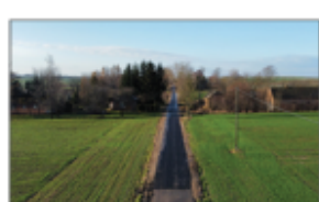
Zdjęcie 10: Droga Stawce Kolonia „do Sokola”