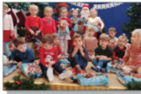
Mikołaj w szkole i przedszkolu w Batorzu