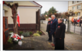
Złożenie kwiatów przy pomniku Józefa Piłsudskiego