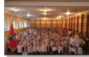
Szkoła do hymnu