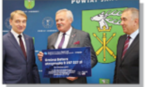
Czek dla Gminy Batorz (II nabór)