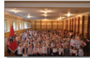
Szkoła do hymnu