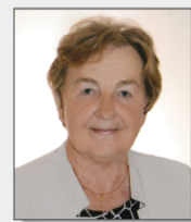
autor: Florentyna Wereska

Sto hektarów mój ty Boże Kto mu w tym wszystkim pomoże Jak przemijają lata młode Nie liczą chłopce na wygodę.