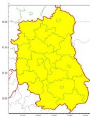
Silny wiatr 2022-01-17 10:51